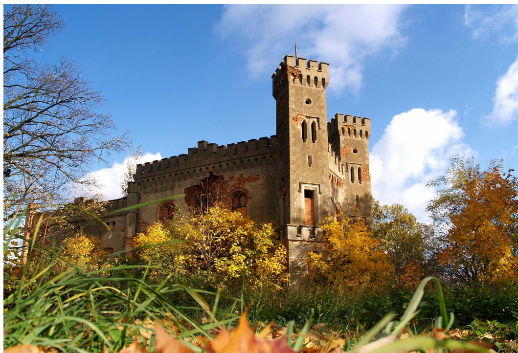
Boguszyce, gmina Oleśnica, pałac neogotycki