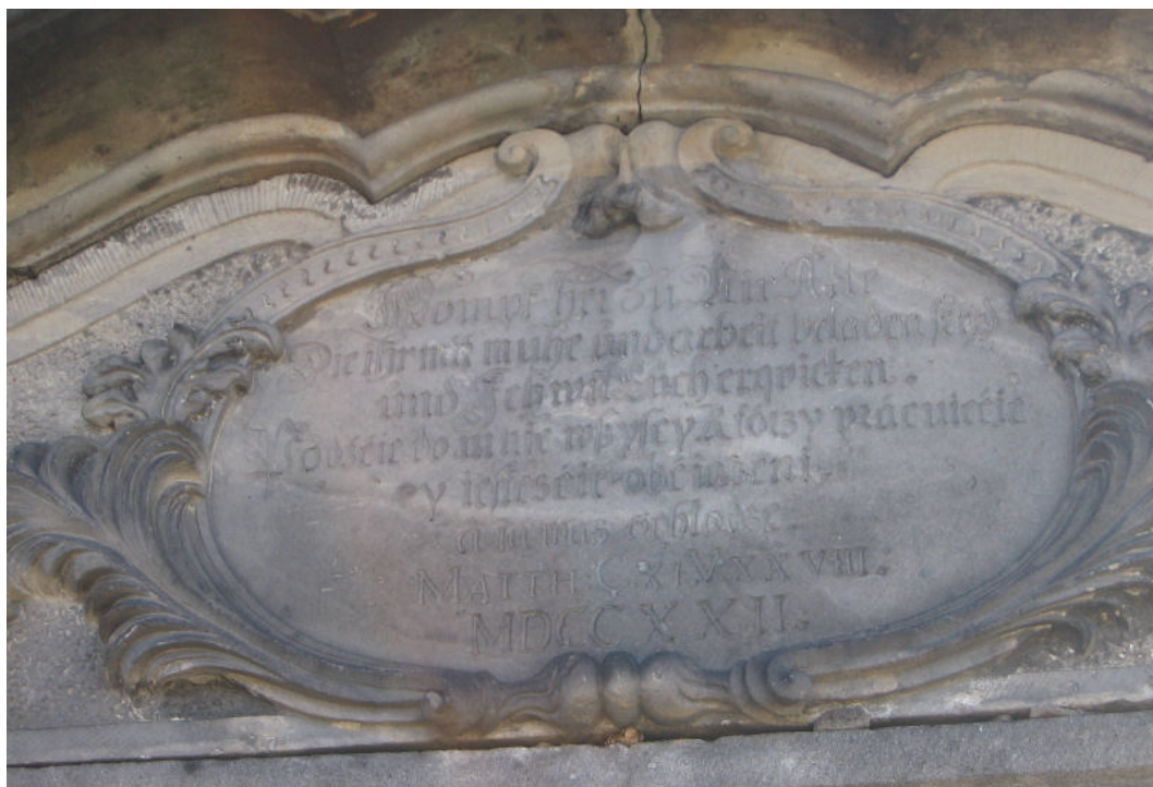
Długołęka, napis w języku polskim w portalu kościoła p.w. Michała Archanioła, fot. archiwum LGD Dobra Widawa