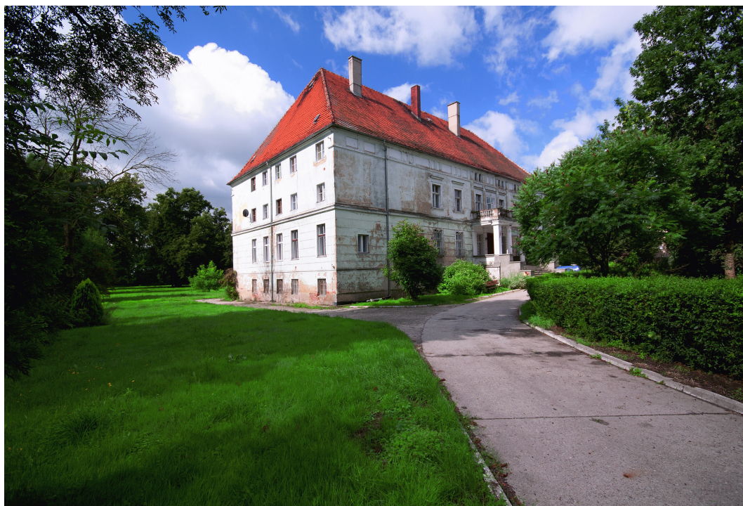
Pąków, gmina Wilków, dwór z XIX w.