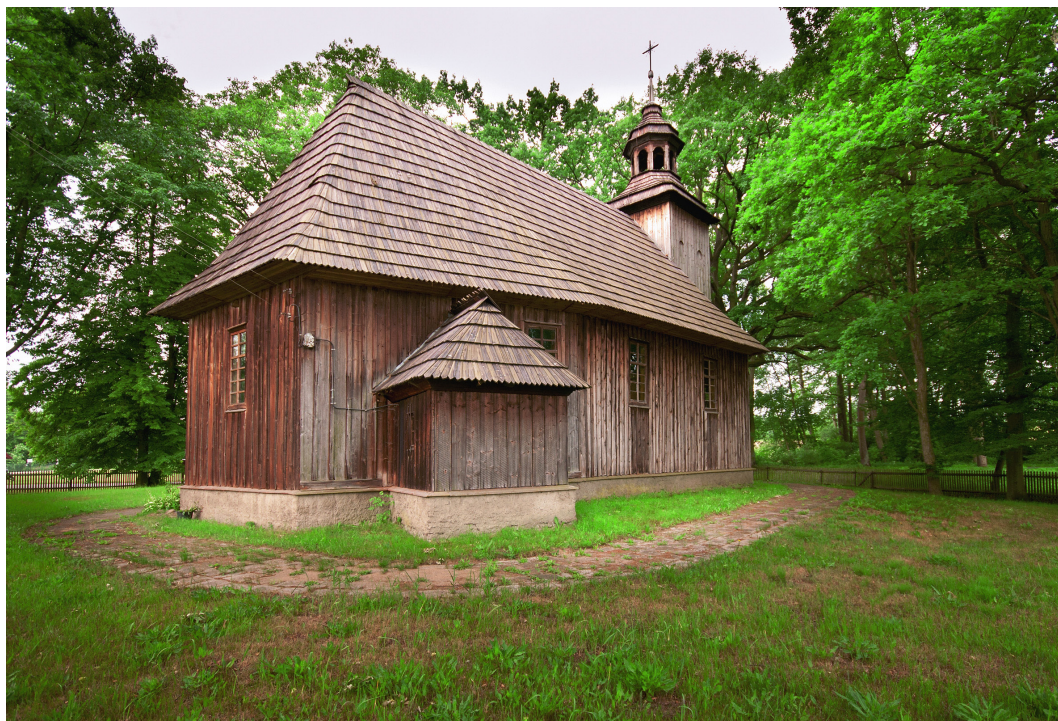
Dziesławice, gmina Międzybórz, kościół z XVII w.