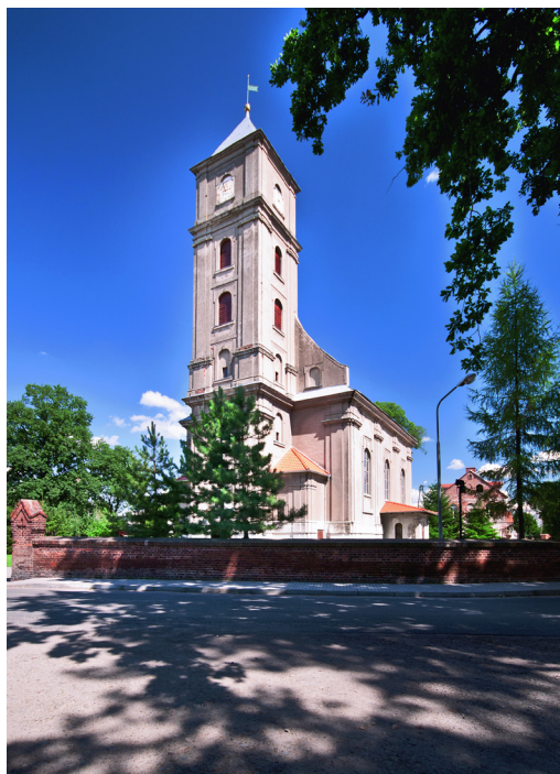
Gajków, gmina Czernica, kościół pw. Św. Małgorzaty, fot. Ryszard Ziemiński