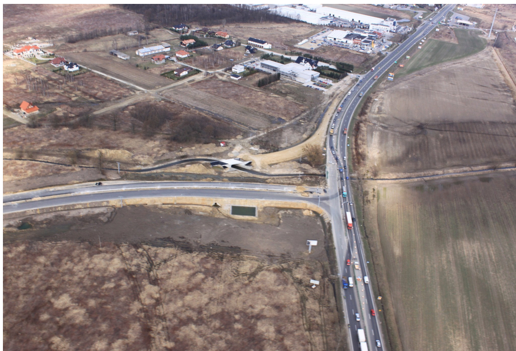
Skrzyżowanie wschodniej obwodnicy Wrocławia i trasy A8 w Długołęce