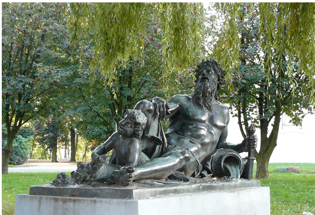
Syców, rzeźba w parku