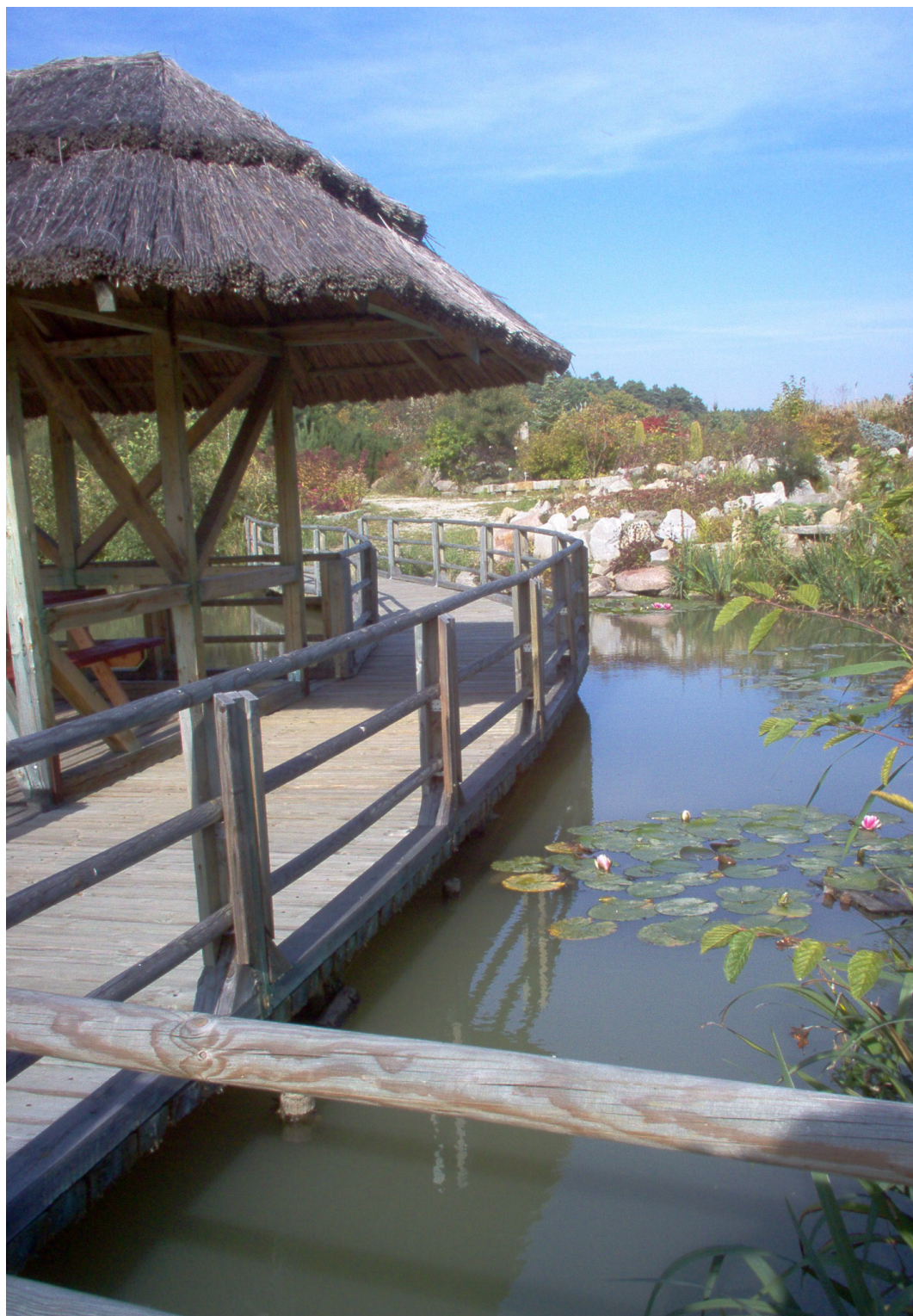
Arboretum w Stradonii Dolnej, gmina Dziadowa Kłoda