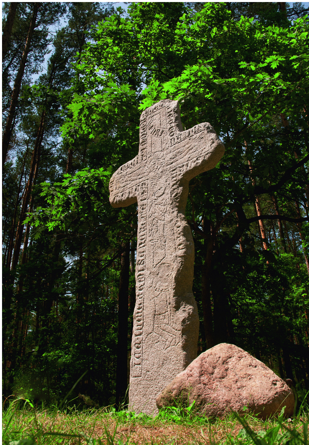
Kijowice, gmina Bierutów, krzyż pokutny