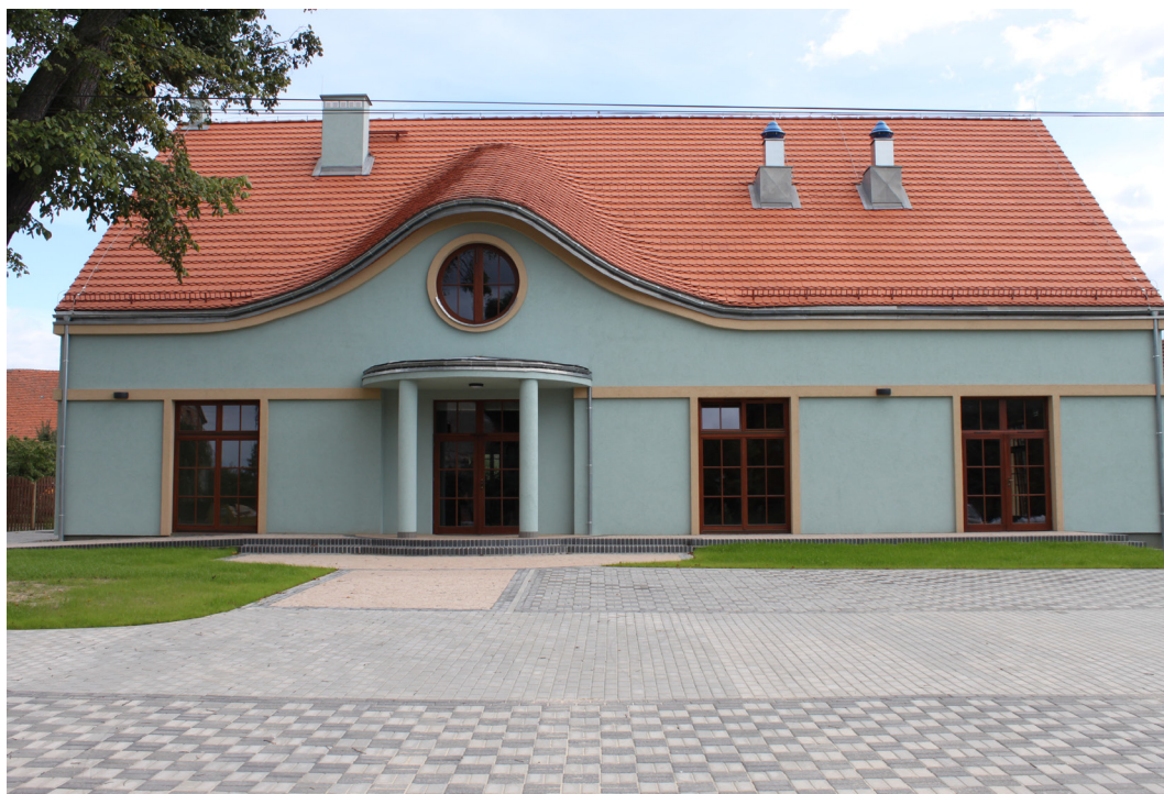
Jenkowice, gmina Oleśnica, świetlica wiejska