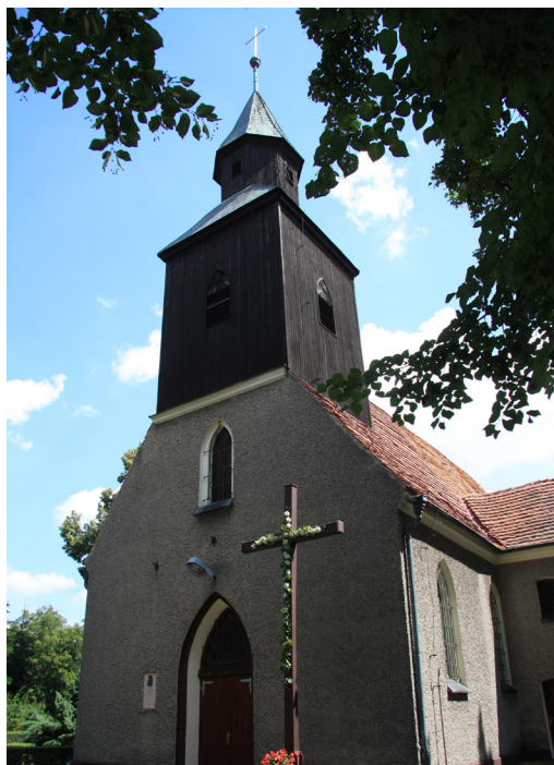
Wabienice, gmina Bierutów, kościół pw. Nawiedzenia Najświętszej Maryi Panny