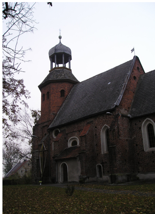
Wojciechów, gmina Wilków, kościół pw. Nawiedzenia NMP