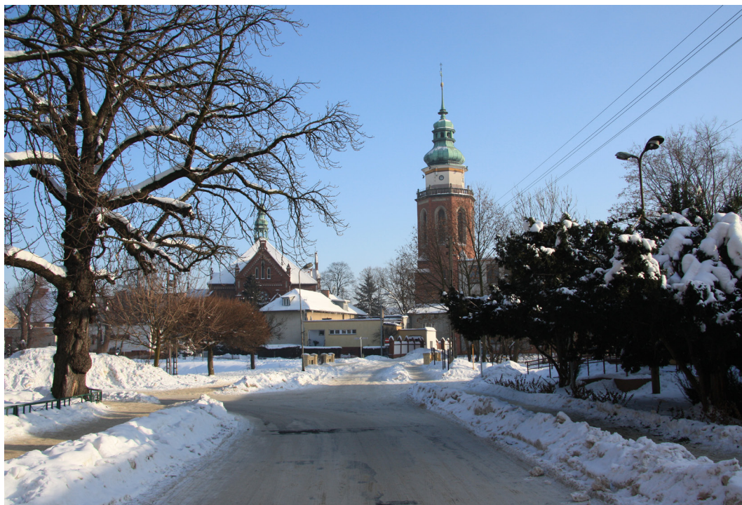
Syców, fot. Mieczysław Skuza