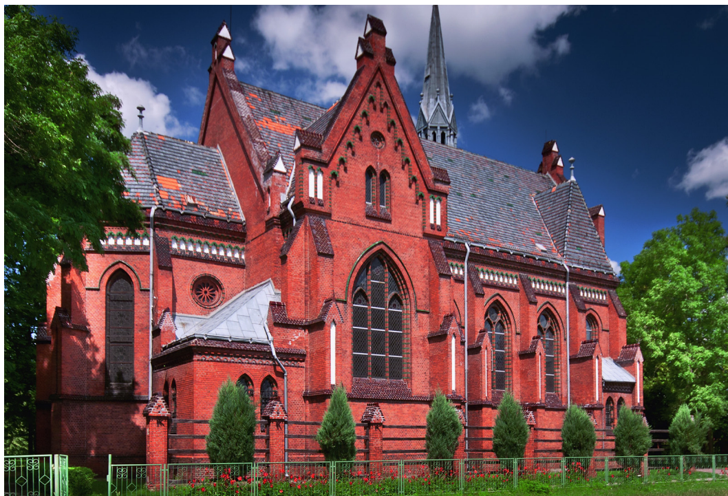
Dobroszyce, zabudowania Caritas Archidiecezji Wrocławskiej, niegdyś dom dla sierot