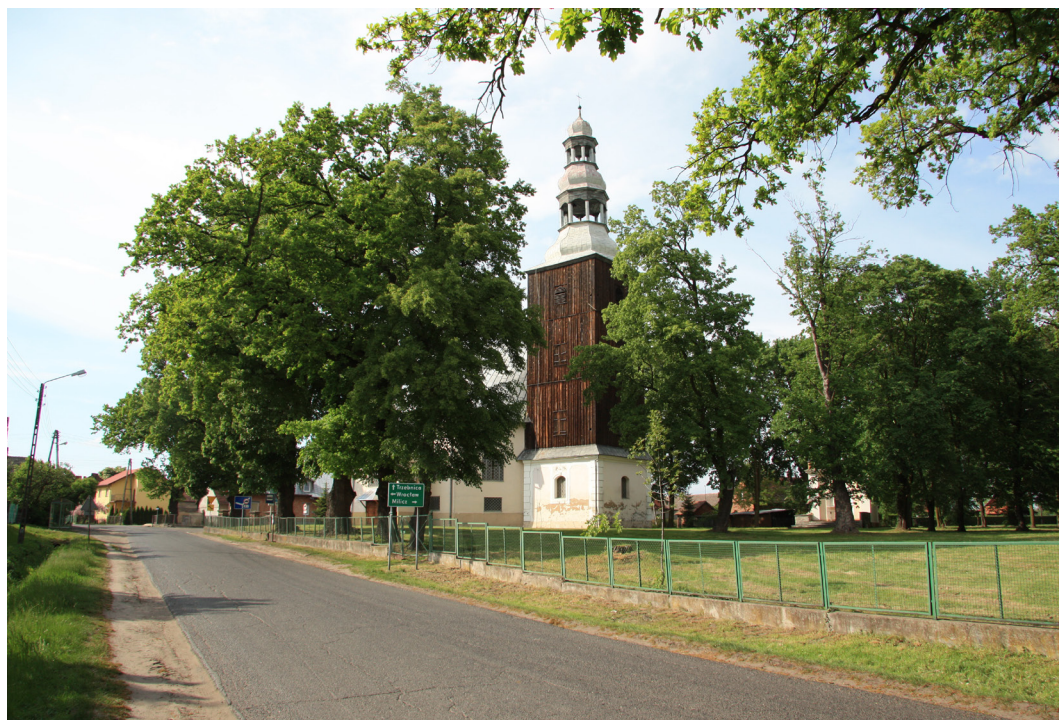
Łozina, gmina Długołęka, Sanktuarium Matki Bożej Bolesnej