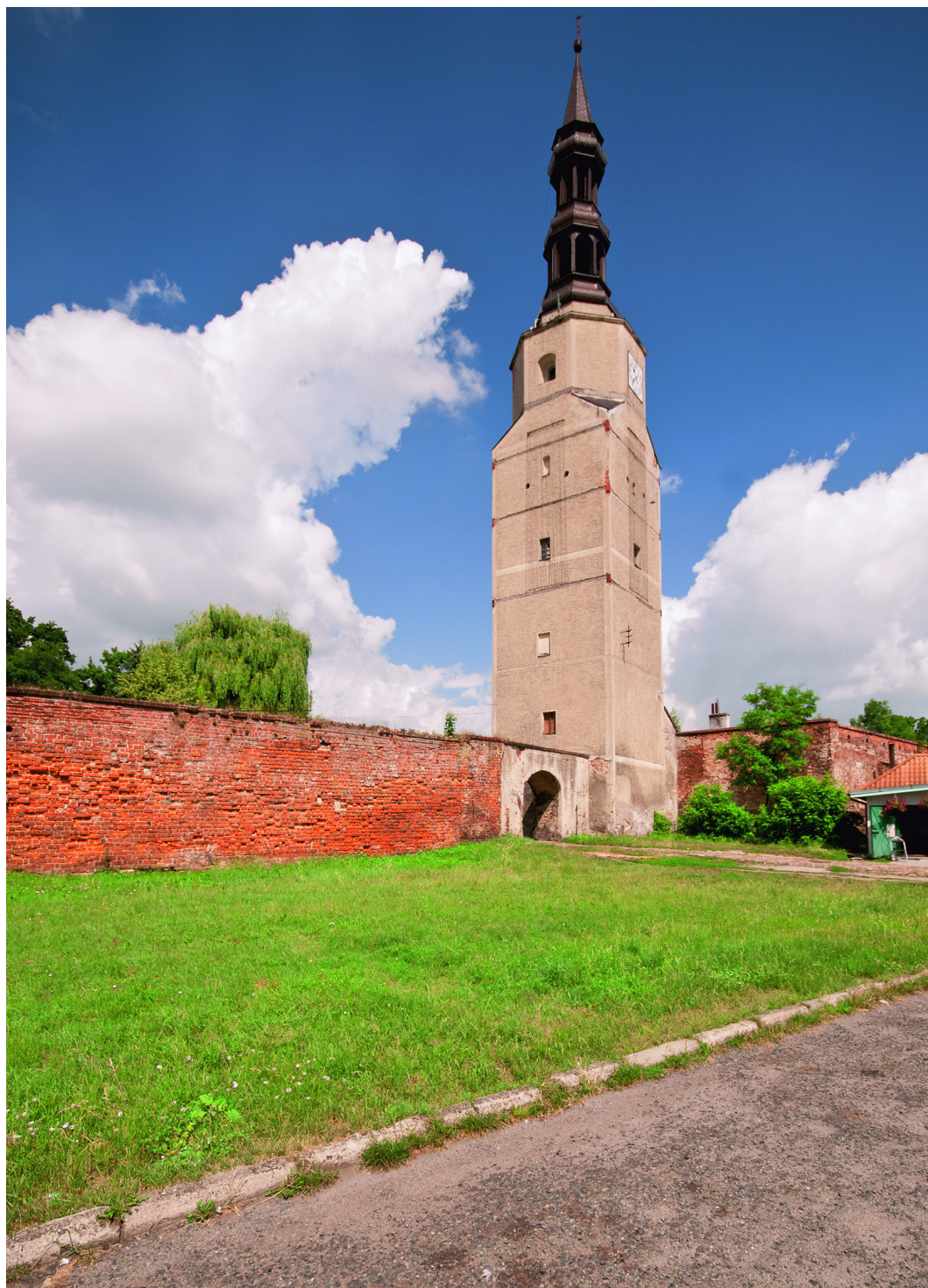
Bierutów, fragment murów obronnych wraz z wieżą