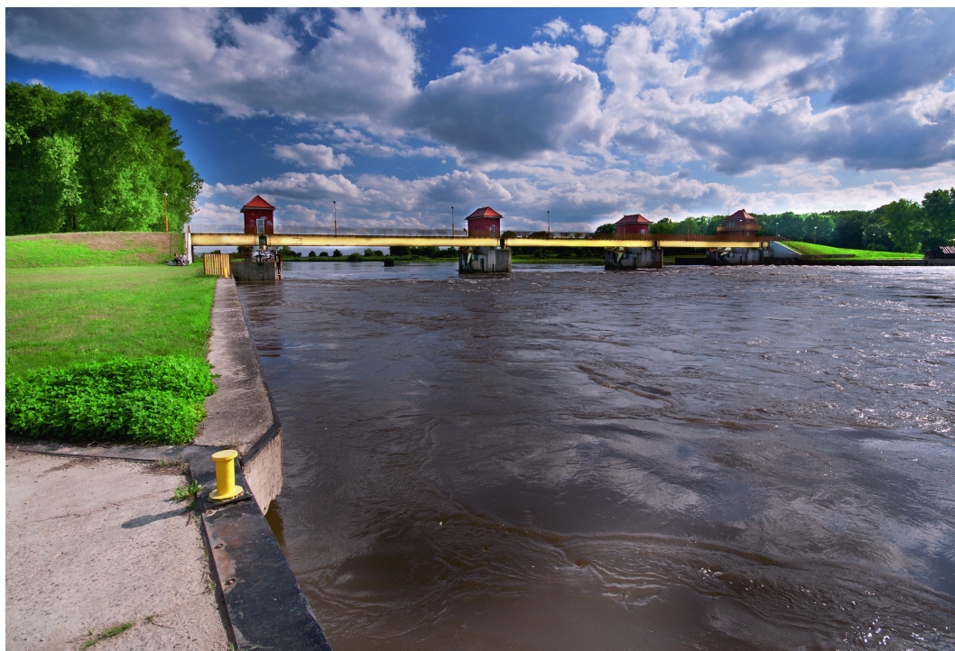
Ratowice, gmina Czernica, jaz na rzece Odrze