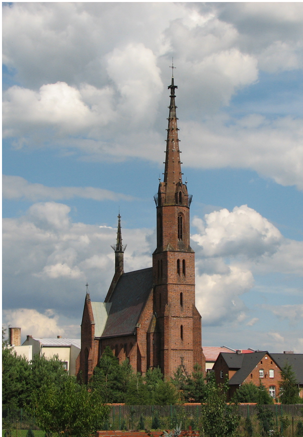
Chrzóstawa Wielka, gmina Czernica, kościół parafialny pw. Niepokalanego Poczęcia NMP, wg projektu Alexisa Langer