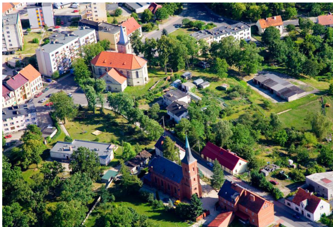
Międzybórz z lotu ptaka, fot. UMIG Międzybórz