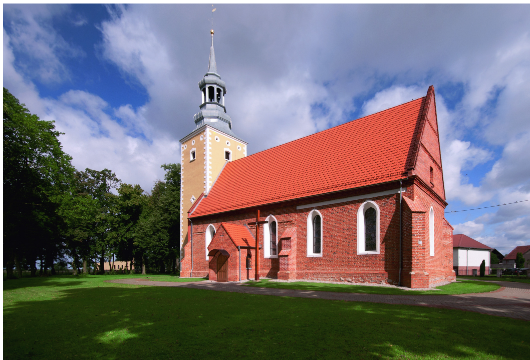
Bukowie, gmina Wilków, kościół pw. Oczyszczenia NMP, fot. Ryszard Ziemiński