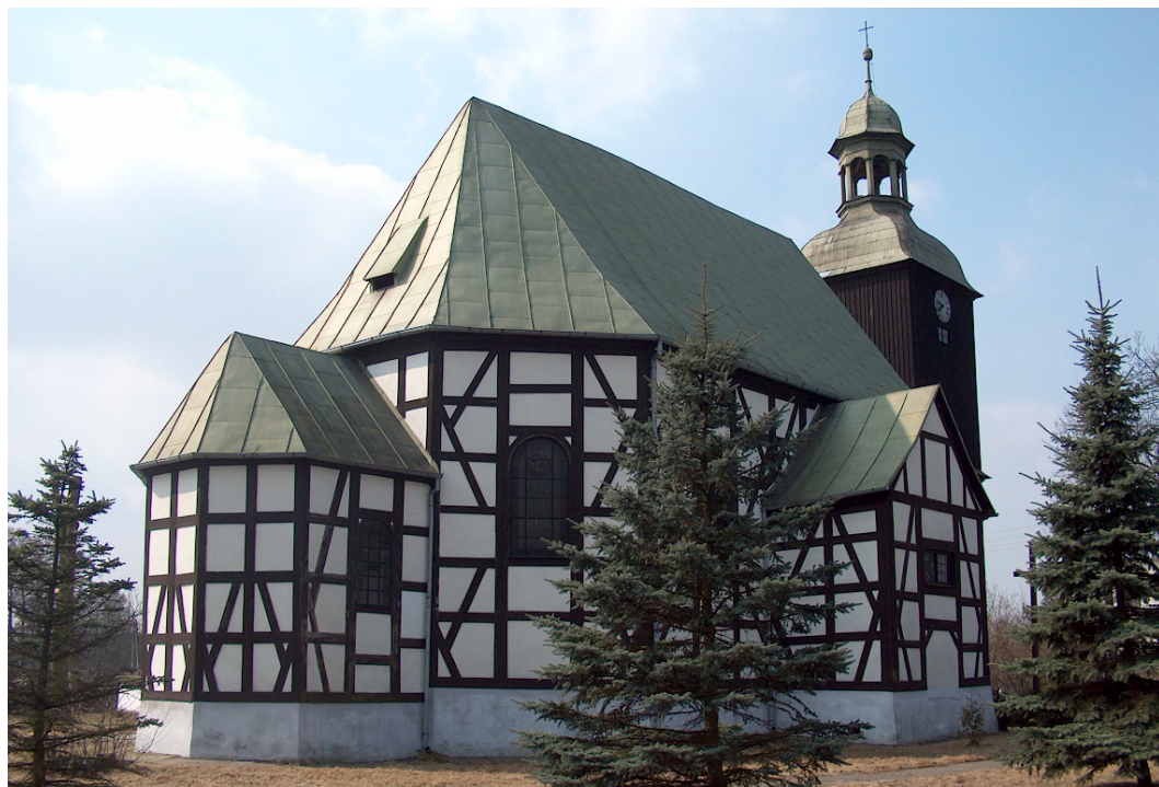
Boguszyce, gmina Oleśnica, kościół pw. NMP Nieustającej Pomocy, fot. UG Oleśnica