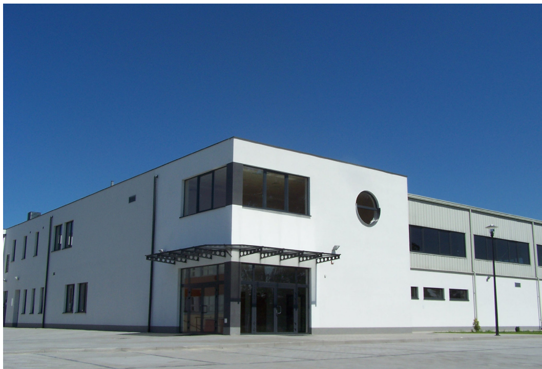
Dziedowa Kłoda, hala sportowa