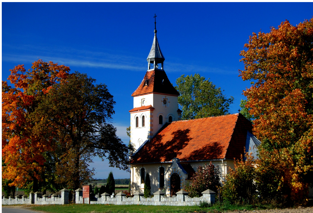
Gołębice, gmina Dziadowa Kłoda, kościół pw. św. Idziego