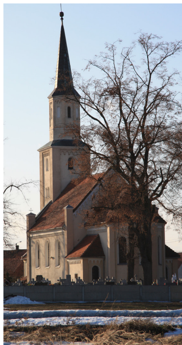
Dziadowa Kłoda, kościół parafialny pw. Niepokalanego Poczęcia NMP