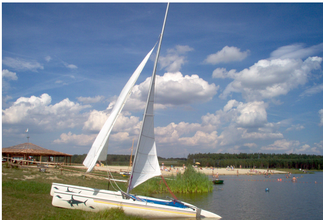
Stradomia Wierzchnia, gmina Syców, zalew na rzece Widawie, fot. Mieczysław Skuza