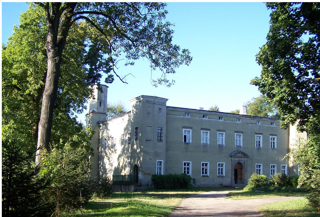
Pałac w Dobroszycach