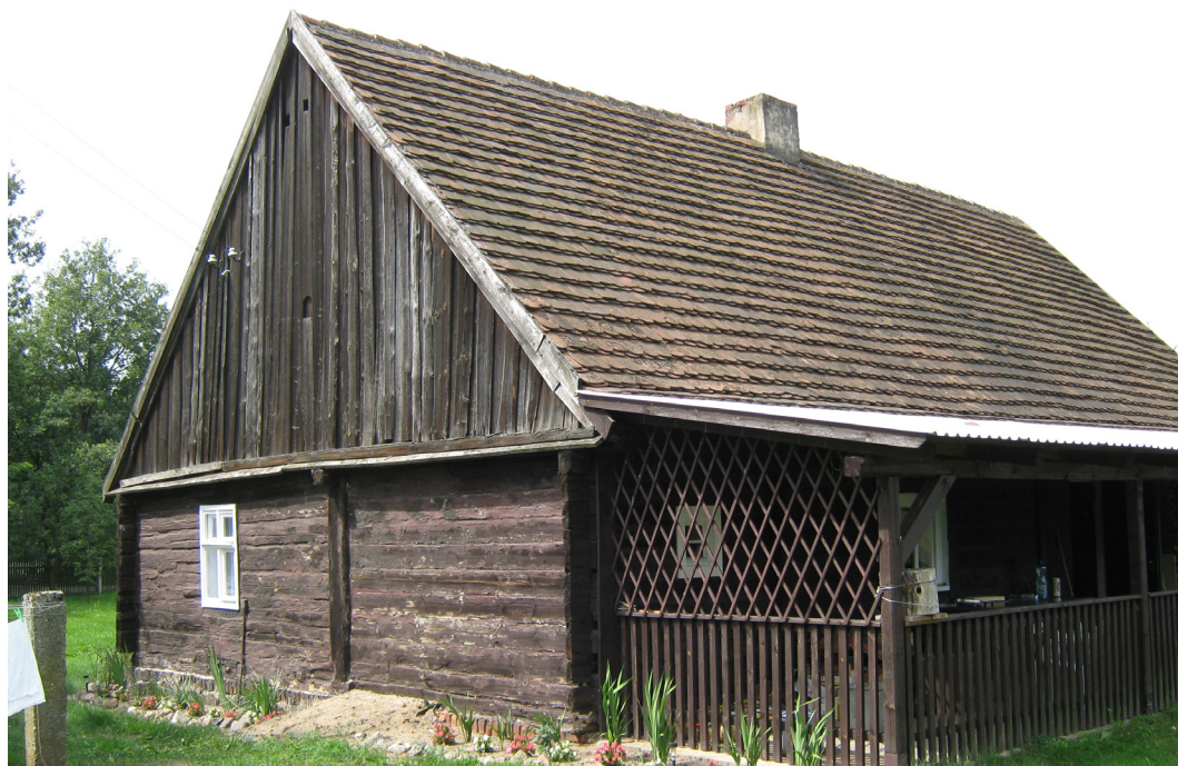
Niwki Książęce, gmina Międzybórz, stara chata drewniana