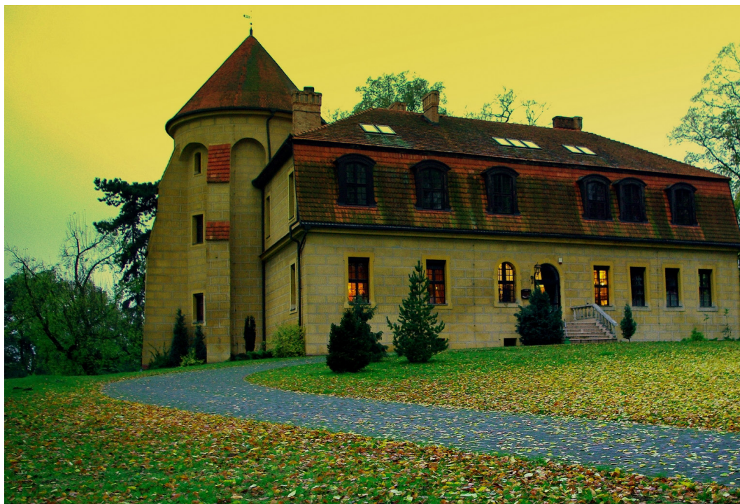
Dobra, gmina Dobroszyce, Pałac, fot. Michał Gajewski