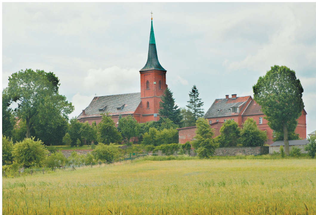
Międzybórz, Kościół św. Józefa Rzemieślnika