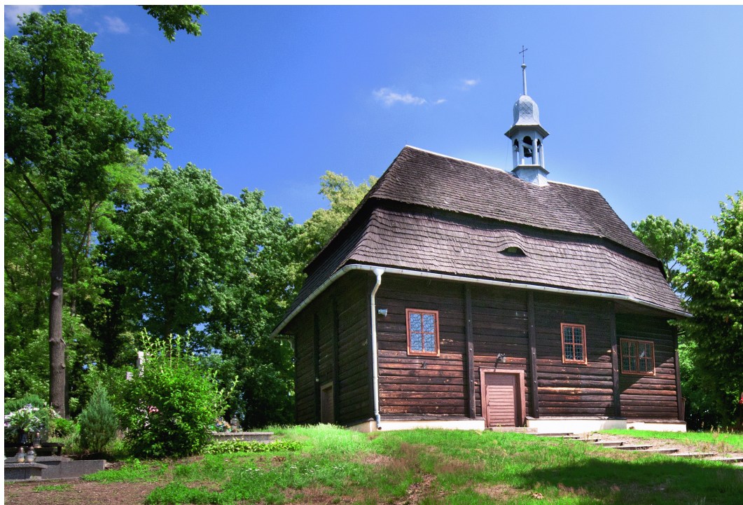
Święty Marek, gmina Syców