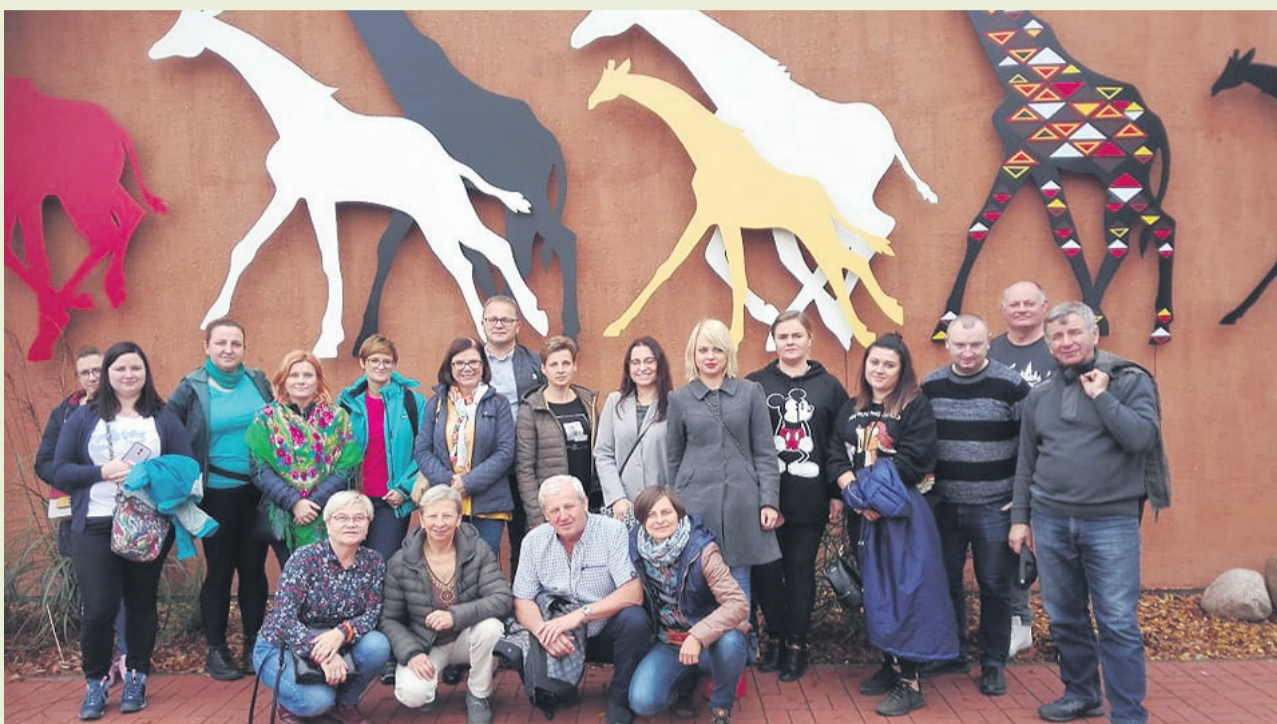
▲ Wizyta studyjna u czeskiego partnera MAS Královédvorsk

storyczna jednym z partnerów projektu EKO LGD. Wyjazd do naszych sąsiadów - mimo niesprzyjającej aury okazał się bardzo owocny i rozwijający.