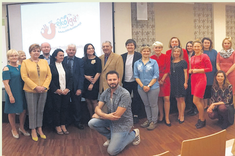
▲ Uroczyste podsumowanie projektu

30 maja 2019 roku odbyło się uroczyste spotkanie w sali konferencyjnej BIFK-u, które miało na celu podsumowanie dotychczasowych działań w projekcie. Przedstawiciele wszystkich szkół biorących udział w tym przedsięwzięciu odebrali upominki dla swoich podopiecznych. Dla każdej szkoły przygotowano komplet książeczek edukacyjnych „BĄDŹ EKO” oraz edukacyjne magnesy i koszulki z logo EKO LGD. Podczas spotkania zostały wręczone certyfikaty potwierdzające udział w projekcie, które mieliśmy zaszczyt przekazać wszystkim osobom i placówkom edukacyjnym zaangażowanym w realizację projektu.