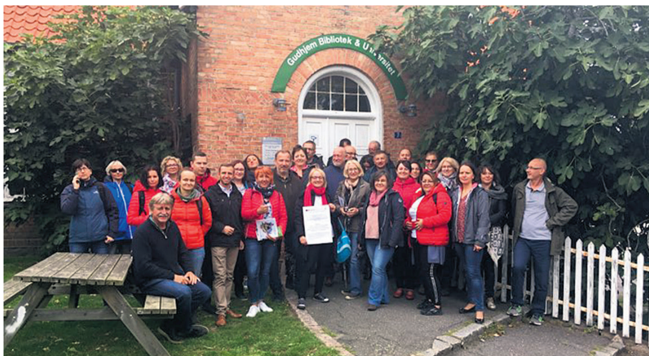
▲ Wizyta w siedzibie LAG Bornholm