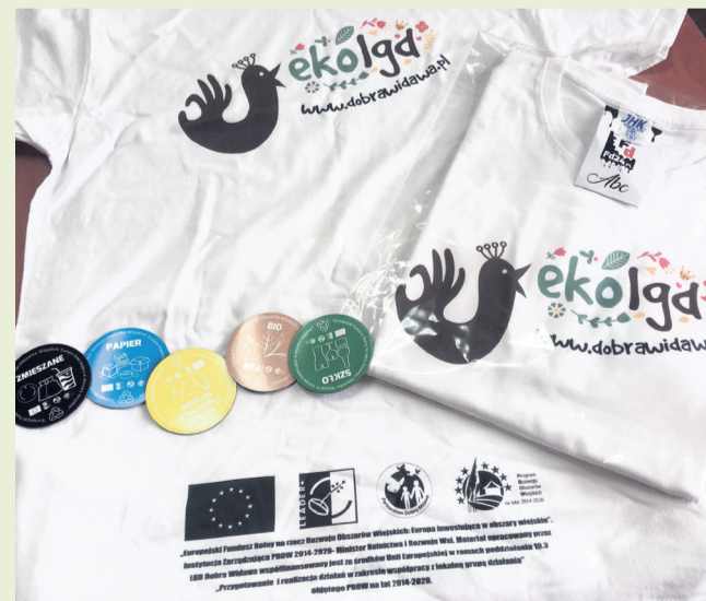
▲ Koszulki i magnesy