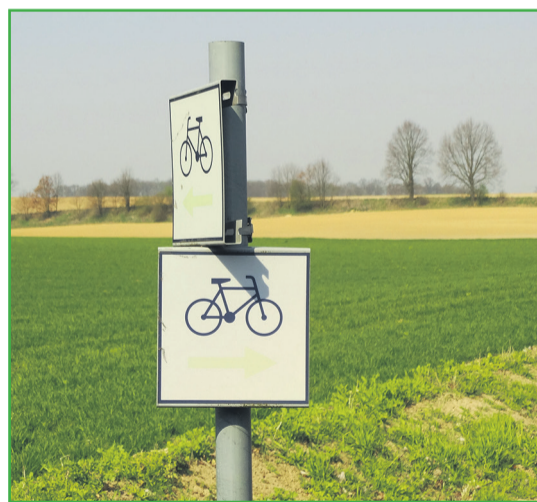
▲ Oznakowanie tras rowerowych w Gminie Długołęka

Biorąc pod uwagę zidentyfikowane problemy, badacze przedstawili następujące rekomendacje: