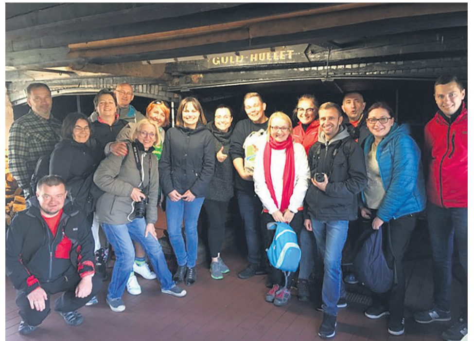
▲ Wizyta w wędzarni w Hasle

Najbardziej charakterystyczne dla Hasle są białe kominy wędzarni, widoczne już przy wjeździe do miasteczka. Wędzarnia w Hasle jest największym tego typu kompleksem na wyspie. Kompleks składa się z trzech budynków, w których oprócz samej wędzarni zorganizowano małe muzeum pokazujące, jak wyglądał kiedyś proces wędzenia. Jest też sklepik z rękodziełem oraz oczywiście restauracja, w której mieliśmy możliwość spróbowania lokalnego przysmaku - „bornholmer”. Wędzony śledź - znany pod nazwą „bornholmer” - aromatyzowany jest dymem wędzarniczym pochodzącym z „bornholmskiego” oleju rzepakowego lub z dodatkiem czosnku niedźwiedziego - popularnej na wyspie rośliny.