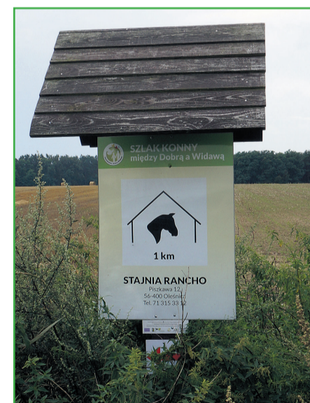
▲ Oznakowanie stajni na szlaku konnym