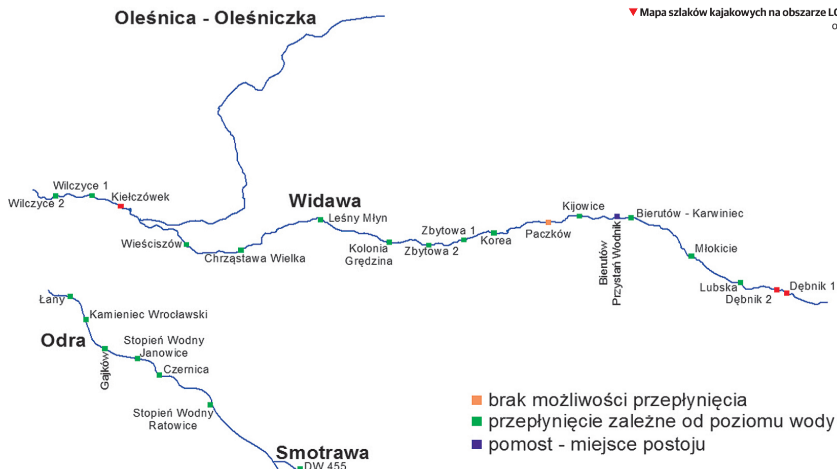
▼ Mapa szlaków kajakowych na obszarze LGD Dobra Widawa oprac. S. Czerwiński

Operacja pn. „Opracowanie dokumentacji dotyczącej szlaków turystycznych - rowerowych/konnych, kajakowych” realizowana w ramach poddziałania 19.2 „Wsparcie na wdrażanie operacji w ramach strategii rozwoju lokalnego kierowanego przez społeczność” w ramach działania „Wsparcie dla rozwoju lokalnego w ramach inicjatywy LEADER” objętego PROW 2014-2020.