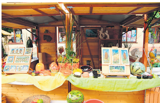
▲ Pracownia Ceramiki Artystycznej SZYNOL nagrodzona w kategorii „Najładniejszy produkt”