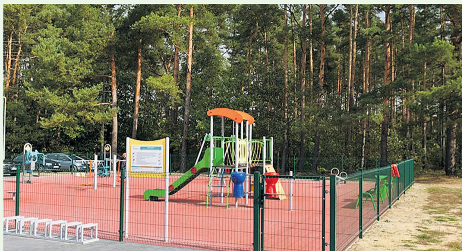
▲ Przecinanie wstęgi na boisku w Miłowicach

Projekt pt. „Budowa świetlicy wiejskiej w Malerzowie wraz z niezbędną infrastrukturą techniczną” został dofinansowany w kwocie 426 392,00 zł ze środków Unii Europejskiej w ramach Programu Rozwoju Obszarów Wiejskich na lata 2014-2020.