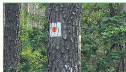
▲ Przykładowe oznakowanie szlaku konnego