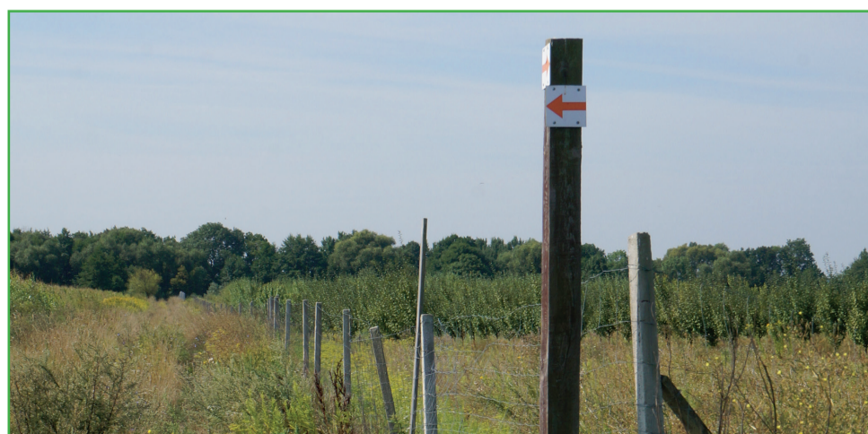
▲ Przykładowe oznakowanie szlaku konnego