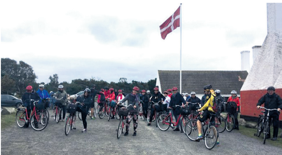
▲ Wyjeżdżamy na naszą 30 km wycieczkę rowerową

Podczas wyjazdu studyjnego mieliśmy możliwość zobaczyć, jak wyglądają trasy rowerowe w północnej części wyspy Bornholm . Nasza wycieczka rowerowa miała ok. 30 kilometrów. Po drodze zobaczyliśmy miasteczko Hasle, zamek Hammershus oraz miejscowość Allinge-Sandvig z pięknymi plażami, portem i uroczym rynkiem.