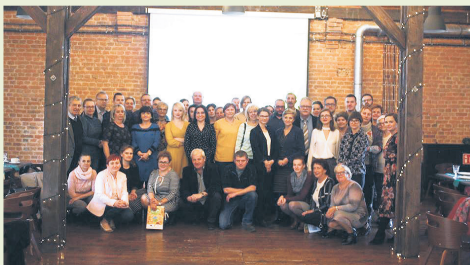
► Uczestnicy spotkania w Starej Kruszarni w Złotym Stoku

Jeszcze raz serdecznie dziękujemy wszystkim osobom, które uczestniczyły w projekcie za swoje zaangażowanie w działania, które podniosły świadomość ekologiczną oraz wiedzę dotyczącą bycia EKO!