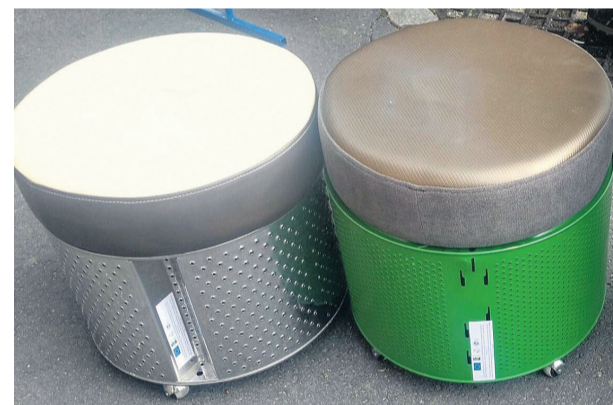
▲ Upcyklingowe skarby

Gminne Ośrodki Kultury z terenu naszych 10 Gmin Partnerskich zostały wyposażone w eko-kąciki, które składają się z: ławek, wieszaków, koszy na śmieci, stolików, organizatorów dla dzieci, siedzisk i donic na kwiaty.