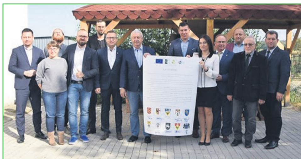
▲ Uroczyste podpisanie Listu intencyjnego