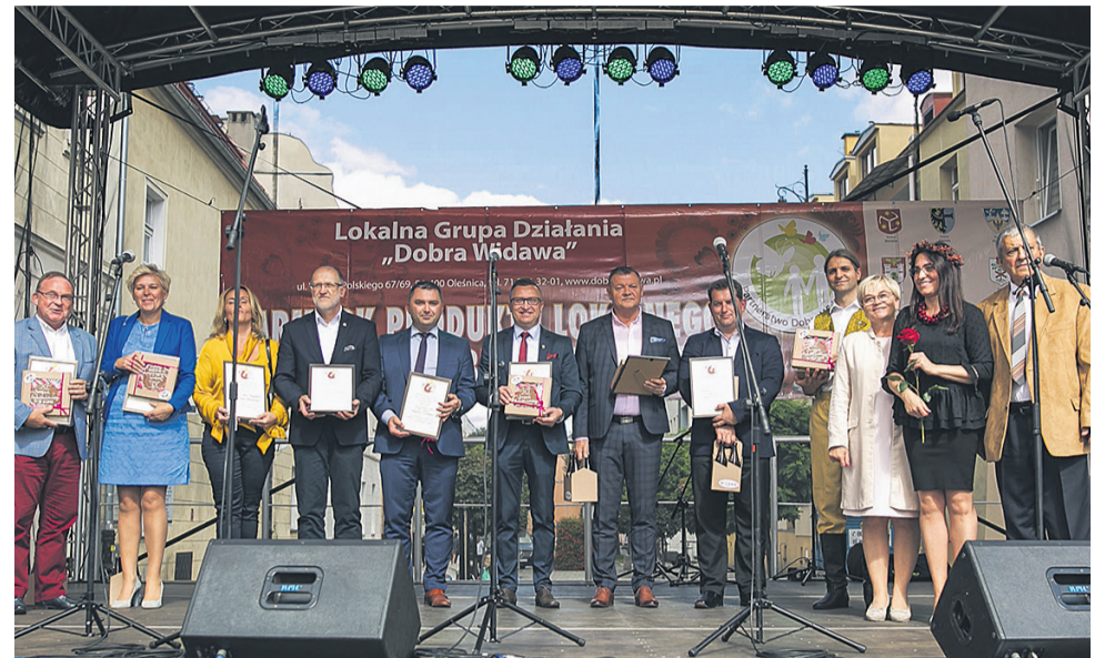
▲ Uroczyste rozpoczęcie XI Jarmarku Produktu Lokalnego