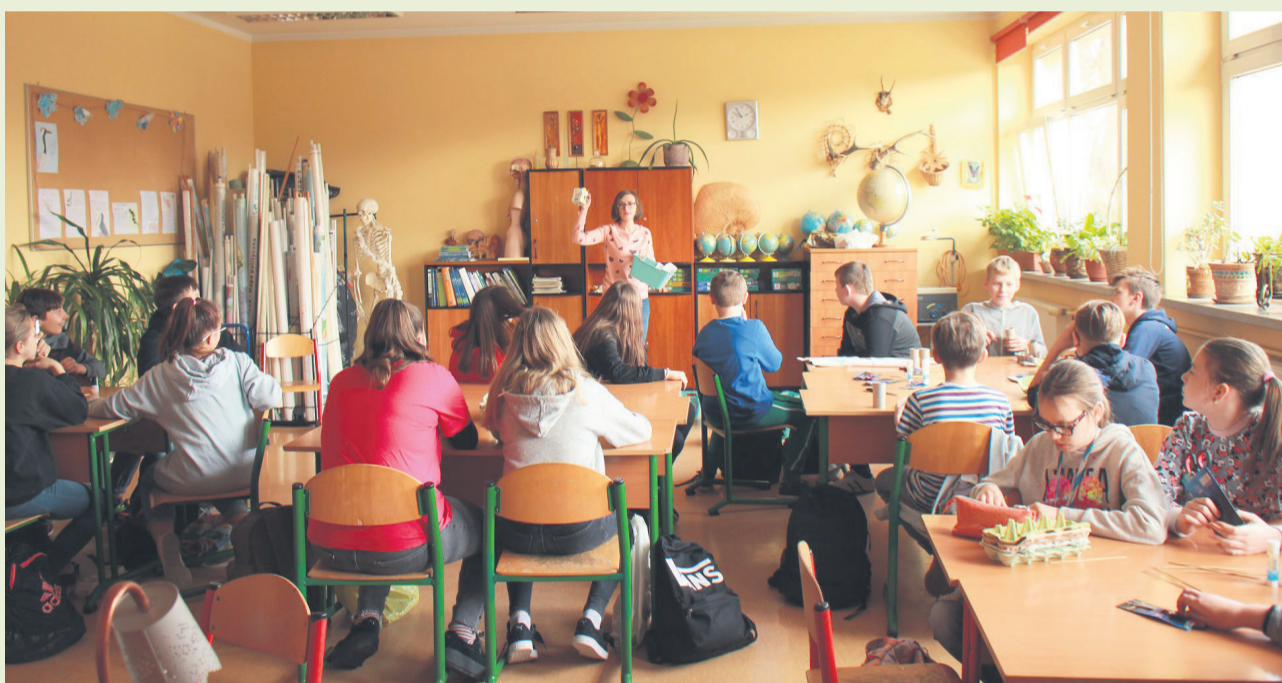
▲ Przedstawiciele Fundacji „Ekopotencjał - Przestrzeń Możliwości” uczą segregacji odpadów

na temat zasad segregowania odpadów, upcyklingu, recyklingu oraz konsekwencji spalania odpadów i ich składowania w miejscach niedozwolonych etc. Uczniowie w niekonwencjonalny sposób przyswajali wiedzę, m.in.: grając w upcyklingowe memory, układając puzzle. Wyławiali też ze skrzynki imitującej zaśmiecony ocean odpady, przy pomocy ręcznie zrobionych wędek. Po wyłowieniu odpadu zadaniem ucznia było jego przyporządkowanie do odpowiedniego pojemnika służącego do segregacji odpadów.