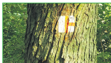
▲ Oznakowanie skrzyżowania na szlaku konnym

Na zły stan szlaków konnych na terenie LGD Dobra Widawa składa się kilka czynników, z których wszystkie wynikają z nienależytej konserwacji lub jej braku, a tylko niektóre z dewastacji. Szlaki konne na terenie LGD Dobra Widawa najprawdopodobniej nie były w żaden sposób utrzymywane od momentu powstania. Dotyczy to zarówno oznakowania jak i dodatkowej infrastruktury (słupy z plakietkami, tablice z regulaminami i inne tablice informacyjne).