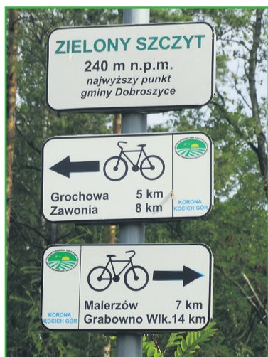
▲ Oznakowanie tras rowerowych w Gminie Dobroszyce

Niestety szlaki rowerowe na terenie LGD Dobra Widawa są miejscami nie najlepiej utrzymanymi (w zakresie oznaczeń szlaków) i odznaczają się słabym wyposażeniem w infrastrukturę dedykowaną rowerzystom. Generalnie jakość oznaczeń w dużej mierze jest zależna od szlaku, co wiąże się z czasem, jaki upłynął od powstania danej trasy lub jej ostatniej konserwacji. Również miejscami zauważalny jest wpływ czynników zewnętrznych względem samego szlaku, czyli „interwencji” związanych z powstawaniem zabudowy, infrastruktury itp., jak i wandalizmem. Kolejną kwestią jest niezgodność przebiegu szlaków rowerowych w terenie względem dostępnych materiałów kartograficznych.