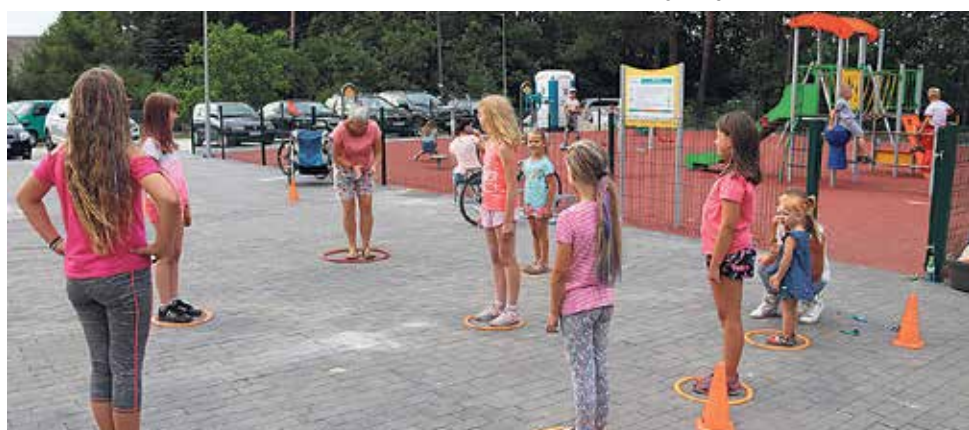
▲ Turniej rodzinny na nowym placu rekreacyjnym w Malerzowie