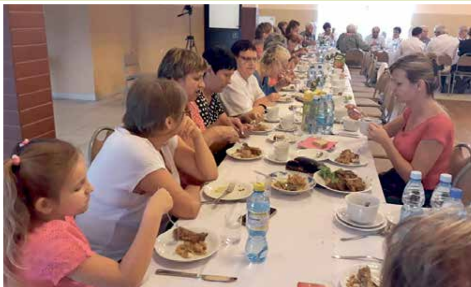
▲ Warsztaty kulinarne w Bukowiu