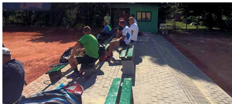
▲ ... i po rewitalizacji