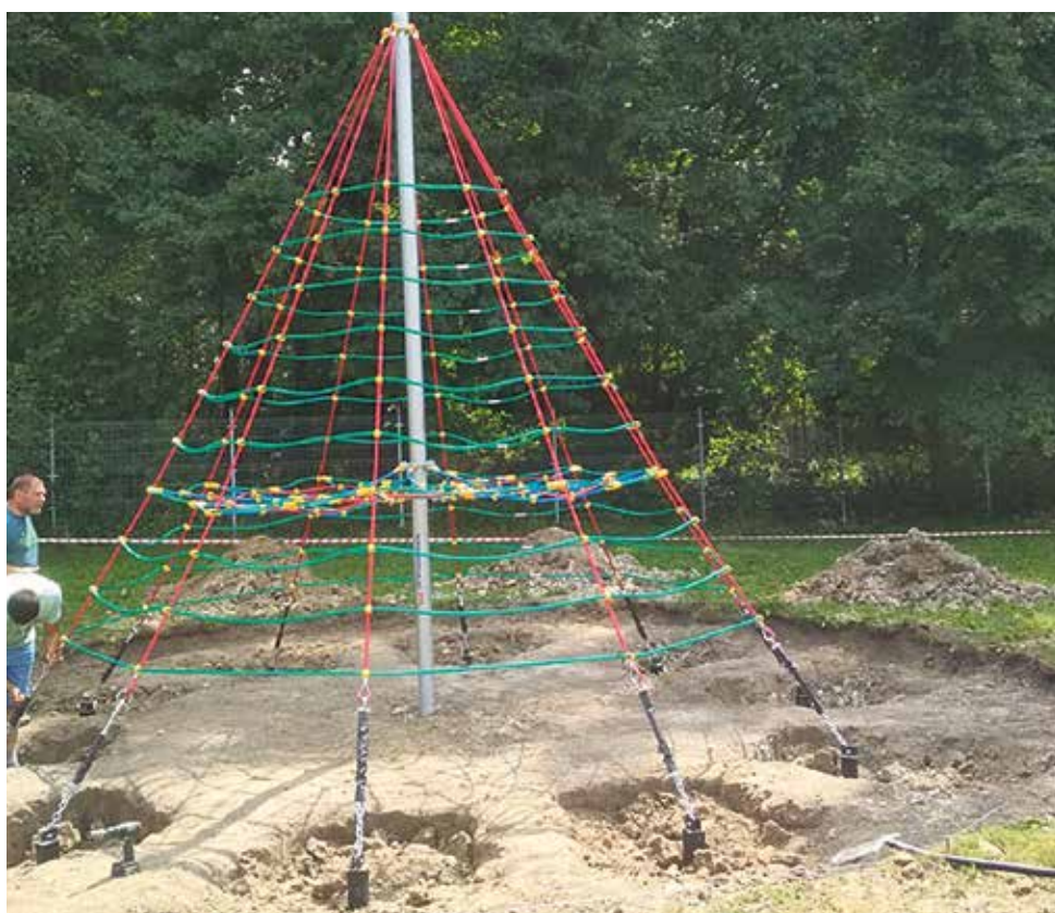
▲ Piramida linowa w Kamieniu