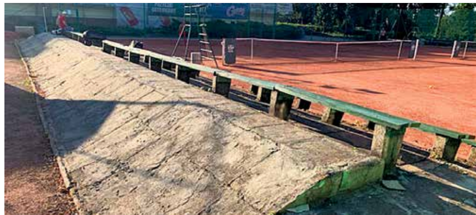
▲ Trybuny na kortach tenisowych w Sycowie przed

W ramach dofinansowanych grantów Grantobiorcy nie uzyskują dochodu, a rozwijana infrastruktura jest ogólnodostępna.