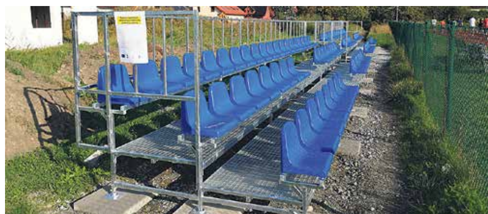
▲ Powstające trybuny na stadionie lekkoatletycznym w Długolece