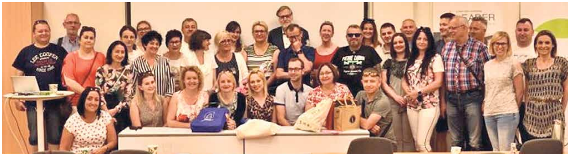
▲ Spotkanie z Hansem-Olofem Stålgren - Koordynatorem Krajowej Sieci Obszarów Wiejskich