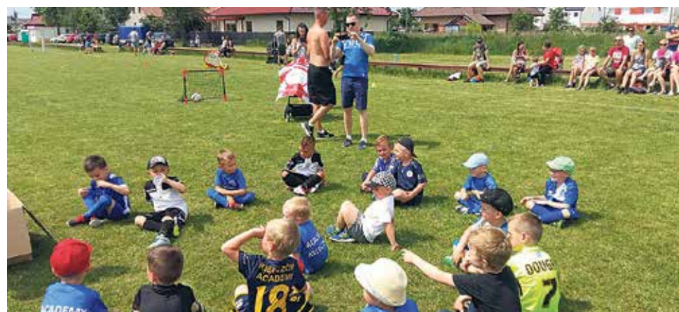
▲ Turniej „Aktywni razem” w Piecovicach