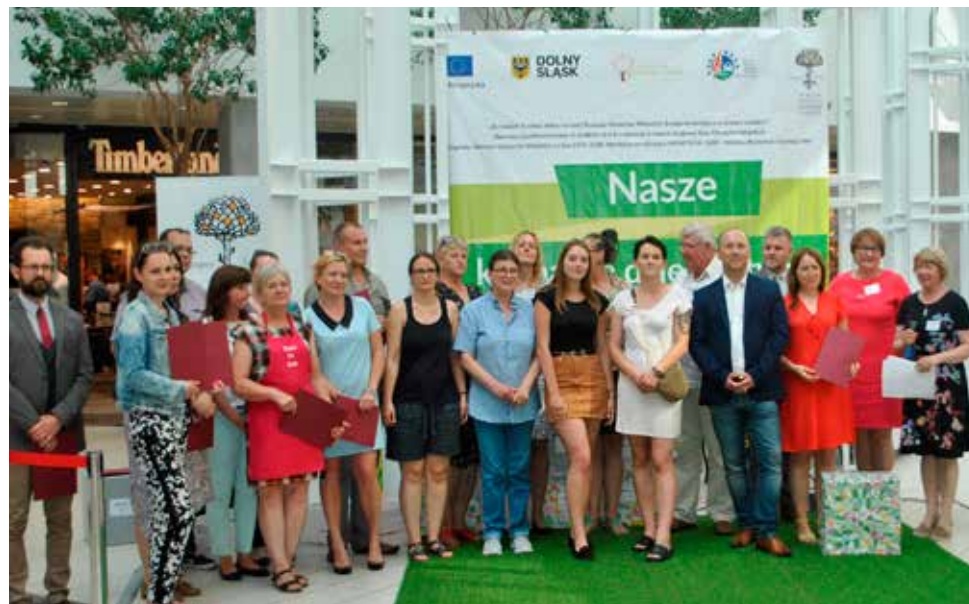
▲ Zwycięzcy konkursu Nasze Kulinarne Dziedzictwo - Smaki Regionów