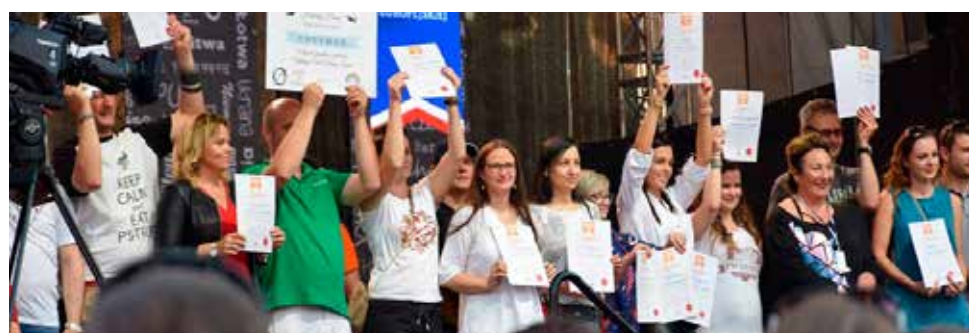
▲ Zwycięzcy konkursu Najlepszy Smak Dolnego Śląska