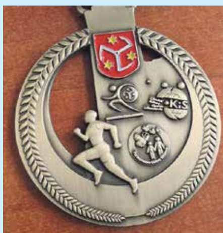
▲ Medale wręczone uczestnikom „I Bierutowskiego Biegu Miejskiego” - ufundowane przez LGD Dobra Widawa

Grupę Działania Dobra Widawa. Następnie na scenie pojawiły się przedszkolaki, uczniowie, grupy taneczne, zespoły ludowe i soliści. Na „Jarmarku Bierutowskim” nie zabrakło stoisk z rękodziełem, gier i zabaw dla dzieci, a także loterii fantowej, z której dochód przeznaczony został na modernizację stadionu.