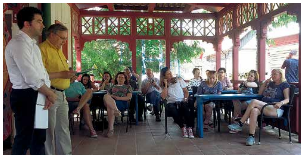
▲ Spotkanie z przedstawicielami Parku Kultury Mannaminne