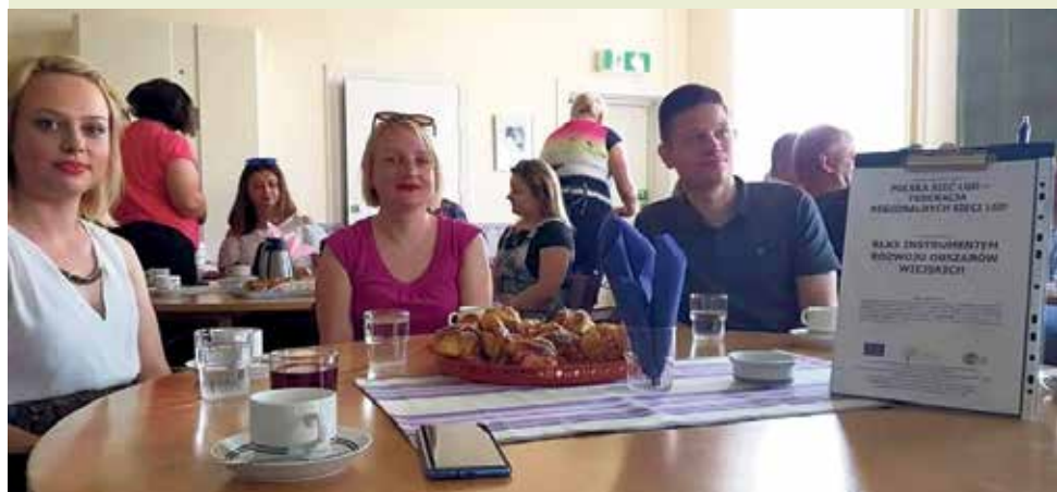
▲ Spotkanie w LGD Höga Kusten

Grupa ta dotychczas sfinansowała 30 projektów, które dotyczą m.in. prowadzenia mikrofunduszu dla nowo powstałych przedsiębiorstw, uruchomienie Internetu szerokopasmowego.