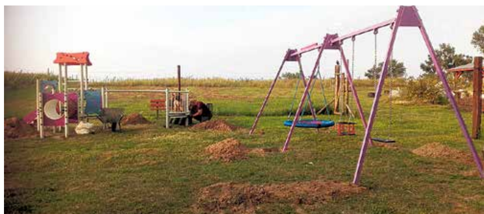
▲ Prace przy montowaniu placu zabaw w Bierutowie