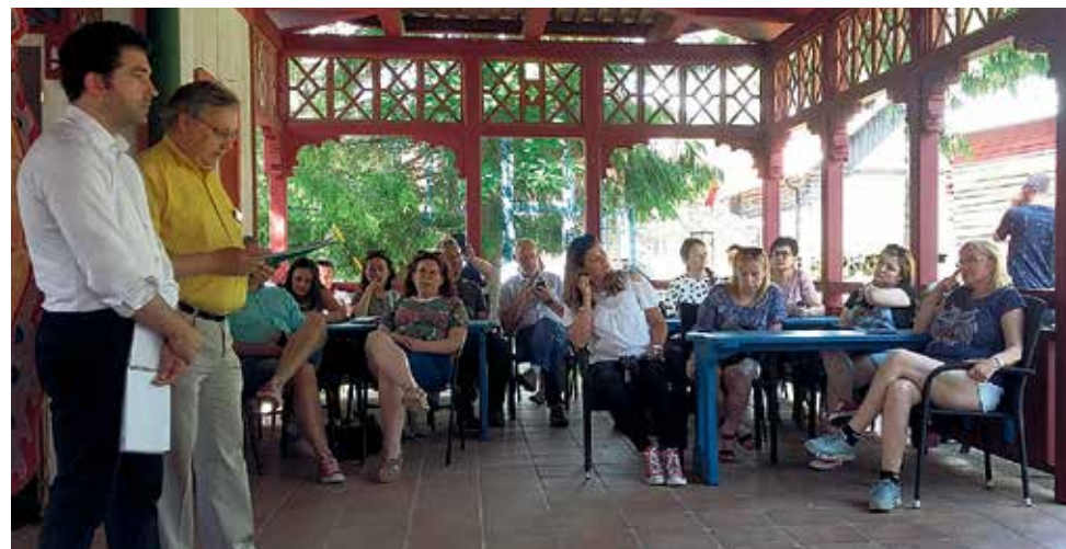
▲ Spotkanie z przedstawicielami Parku Kultury Mannaminne

iedzictwo kulturowe i artystyczne Wysokiego Wybrzeża. Ma to być również miejsce wymiany doświadczeń ludzi związanych z kulturą i edukacją dzieci.