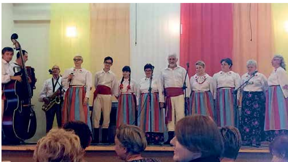
▲ Warsztaty muzyczne w Domu Kultury w Wilkowie

ło dofinansowanie na realizację projektu Po naszymu - poznajemy dziedzictwo kulturowe i kulinarne Gminy Wilków w ramach projektu grantowego pn.: „Dobra Widawa” nasze dziedzictwo i tożsamość.