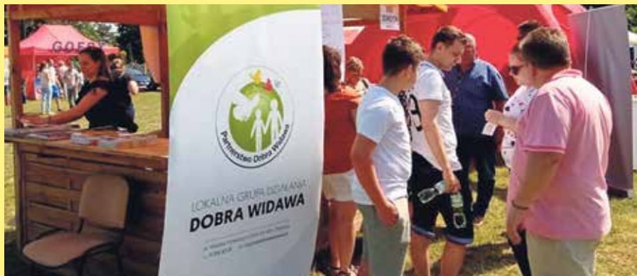
▲ Stoisko LGD Dobra Widawa na „Biskupickim Złotym Kłosie”