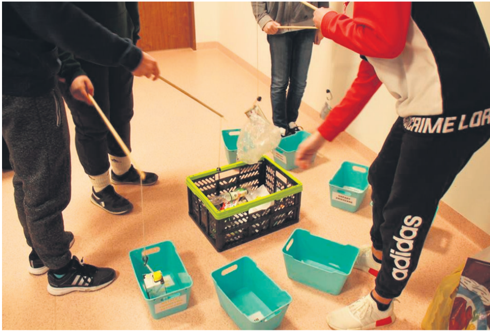
▲ Odlawianie śmieci z oceanu

Na każdych zajęciach uczniowie przekształcali odpady w przedmioty użytkowe oraz dekoracyjne, stosując w ten sposób upcykling. Poniżej zaprezentowano kilka przykładowych prac.