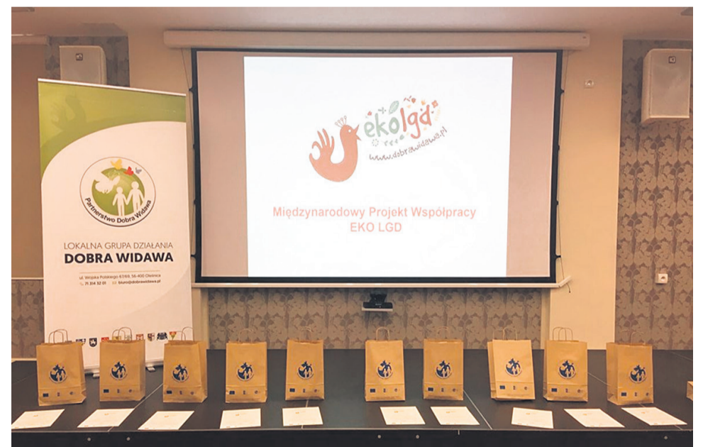
▲ Materiały promocyjne i certyfikaty przygotowane do wręczenia