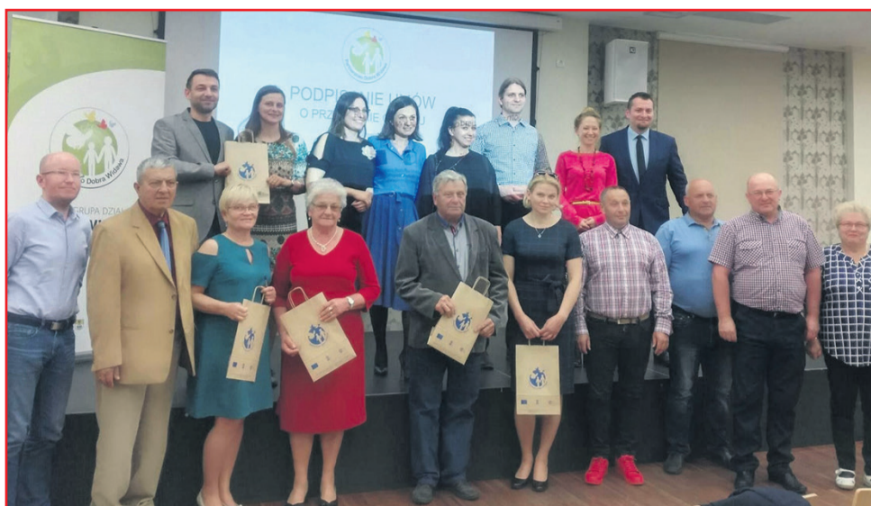
▲ Wspólne zdjęcie Grantobiorców i przedstawicieli Stowarzyszenia LGD Dobra Widawa