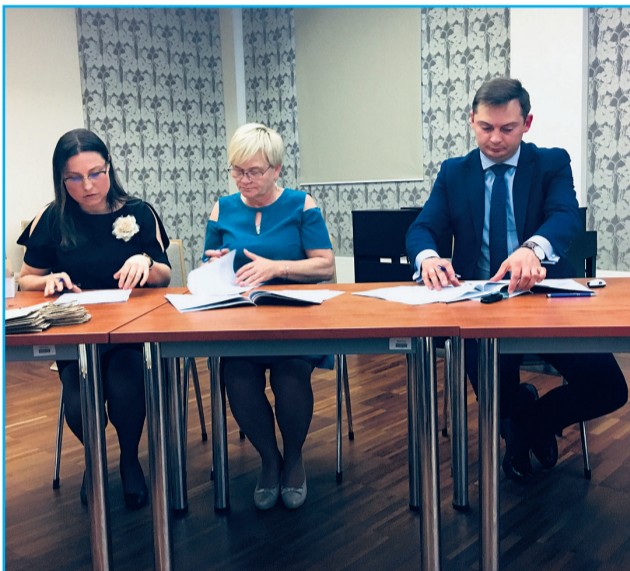
▲ Wójt Gminy Dobroszyce - Artur Ciosek