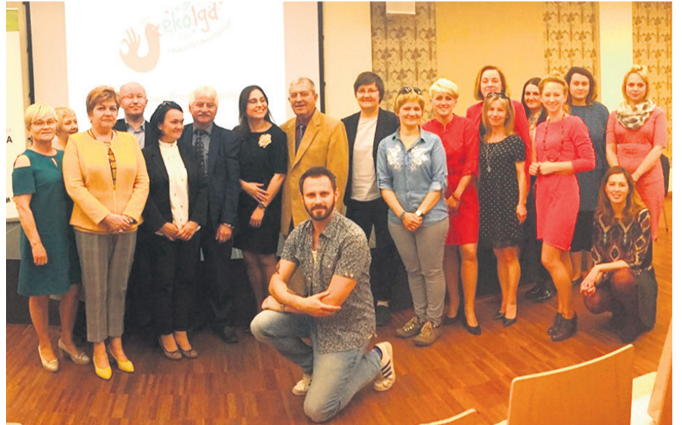
▲ Uroczyste podsumowanie projektu