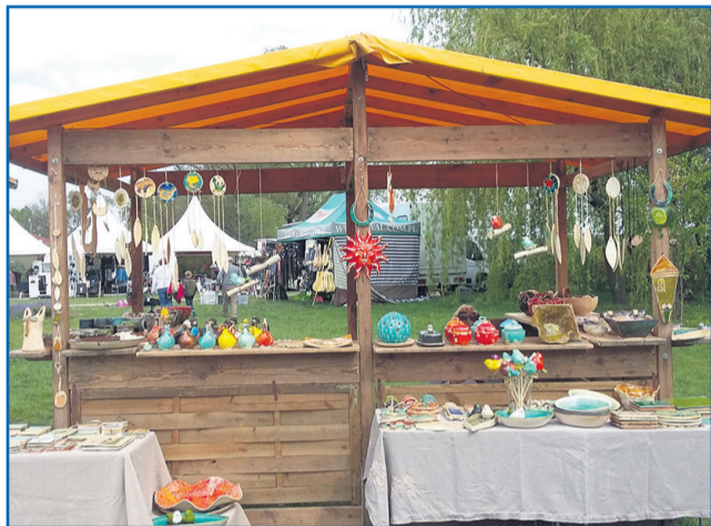
▲ Arnika Wiatrowska - pracownia ceramiczna „Tutubi”