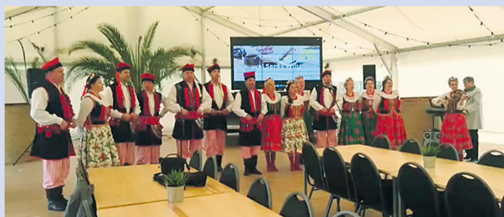
▲ Imprezę uświetniły występy zespołów ludowych: w sobotę występowali „Sycowiaci” a w niedzielę „Bierutowianie BIS”