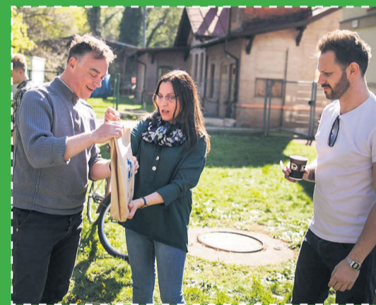
▲ Ole otrzymał materiały promujące nasze Stowarzyszenie