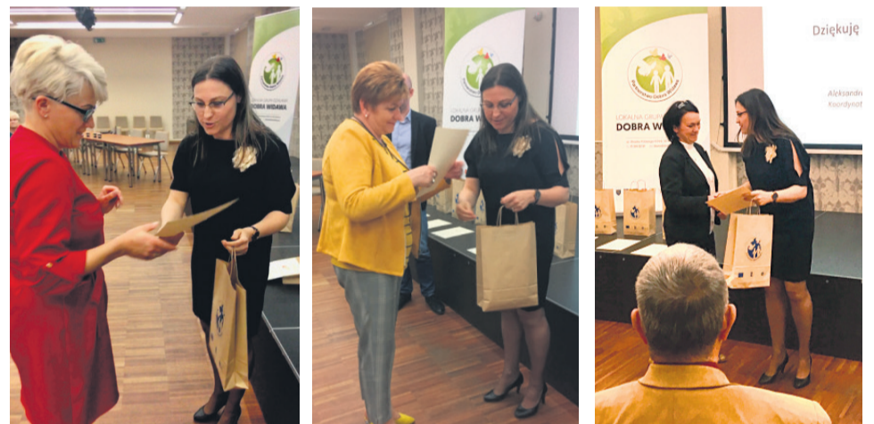
▲ Wręczenie certyfikatów przez członków Zarządu LGD Dobra Widawa