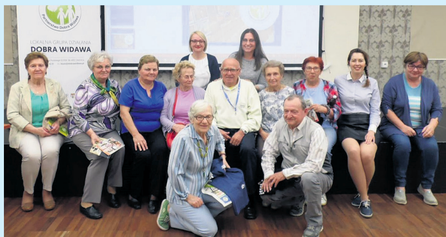
▲ Spotkanie z Sekcją Regionalną UTW w Oleśnicy

Bardzo dziękujemy za spotkanie i ciepłe przyjęcie słuchaczom Uniwersytetu Trzeciego Wieku. Miło nam było Państwa poznać. Do zobaczenia wkrótce.