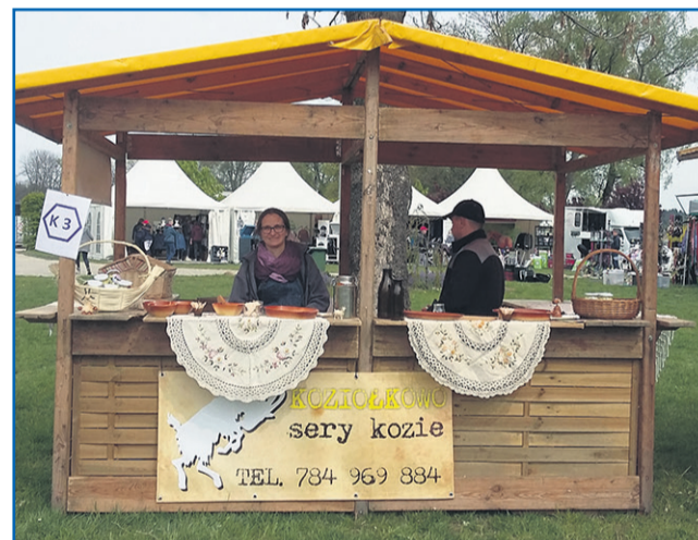
▲ „Koziołkowo” - sery kozie