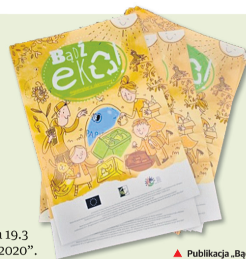
▲ Publikacja „Bądź Eko”

Kwota wsparcia: 100 000,00 zł . Projekt współfinansowany jest ze środków Unii Europejskiej w ramach poddziałania 19.3 „Przygotowanie i realizacja działań w zakresie współpracy z lokalną grupą działania” objętego PROW na lata 2014 - 2020”.