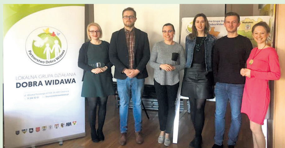
▲ Spotkanie z Partnerami projektu, przedstawicielami Brzesko – Oławskiej Wsi Historycznej

Celem projektu jest: „Identyfikacja i promocja kultury oraz dziedzictwa kulturowego związanego z tradycją i sztuką ludową obszarów partnerskich.” W kwietniu odbyło się w siedzibie naszego stowarzyszenia kolejne spotkanie z Partnerami projektu, przedstawicielami Brzesko – Oławskiej Wsi Historycznej. Podczas spotkania wspólnie przygotowaliśmy planowane działania. Przed nami m.in.: spotkania integracyjne dla rękodzielników i zespołów artystycznych, konkursy, konferencje. Więcej szczegółów już wkrótce.