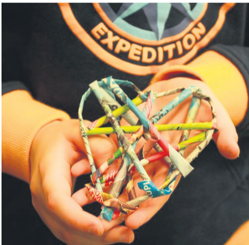
▲ Serduszek z wikliny papierowej

Na każdych zajęciach uczniowie przekształcali odpady w przedmioty użytkowe oraz dekoracyjne, stosując w ten sposób upcykling. Poniżej zaprezentowano kilka przykładowych prac.