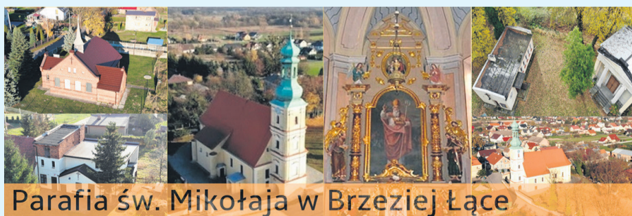
Parafia św. Mikołaja w Brzeziej Łące

Tytuł zadania: Szlak cyklistów w Brzeziej Łące – przystanek dla rowerzystów i turystów przy zabytkowych figurach dla popularyzacji wiedzy o dawnej sztuce sakralnej