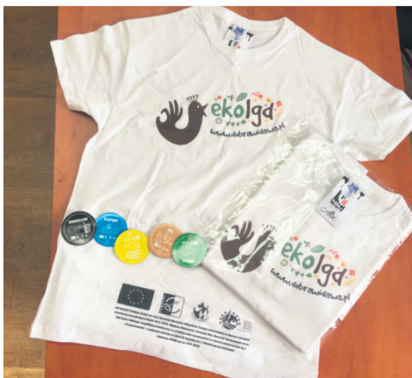
Koszulki i magnesy ▶

W projekcie zakupiono także edukacyjne gadżety, m.in.: magnesy z informacjami na temat segregacji odpadów oraz koszulki z logo projektu. Pod koniec czerwca do 10 ośrodków kultury na obszarze Partnerstwa zostaną przekazane komplety mebli wykonanych metodą upcyklingu, tzw. "upcyklingowe kąciki".