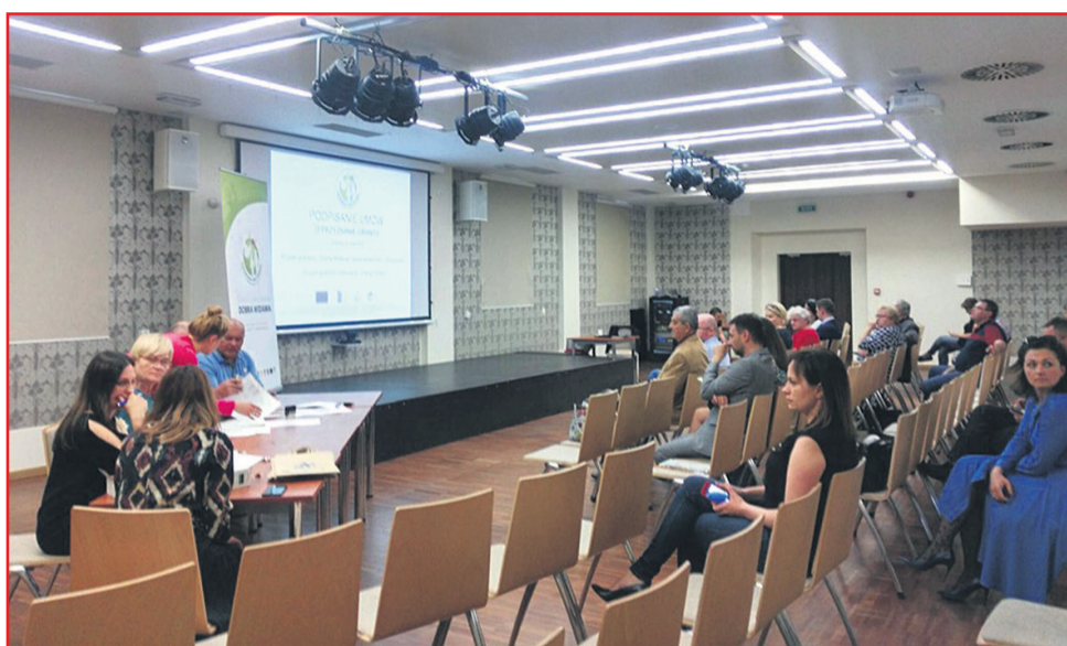
▲ Podpisywanie umów z Grantobiorcami