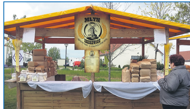
▲ „Młyn w Idzikowicach” mąki, otręby, przemiał zbóż