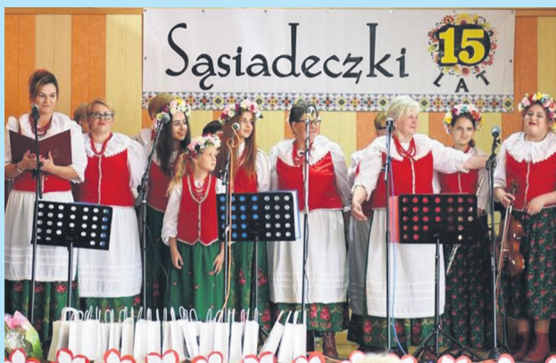
▲ Jubileusz zespołu ludowego „Sąsiadeczki”