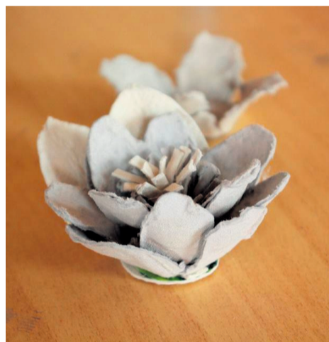
▲ Kwiatek z wytłaczanki