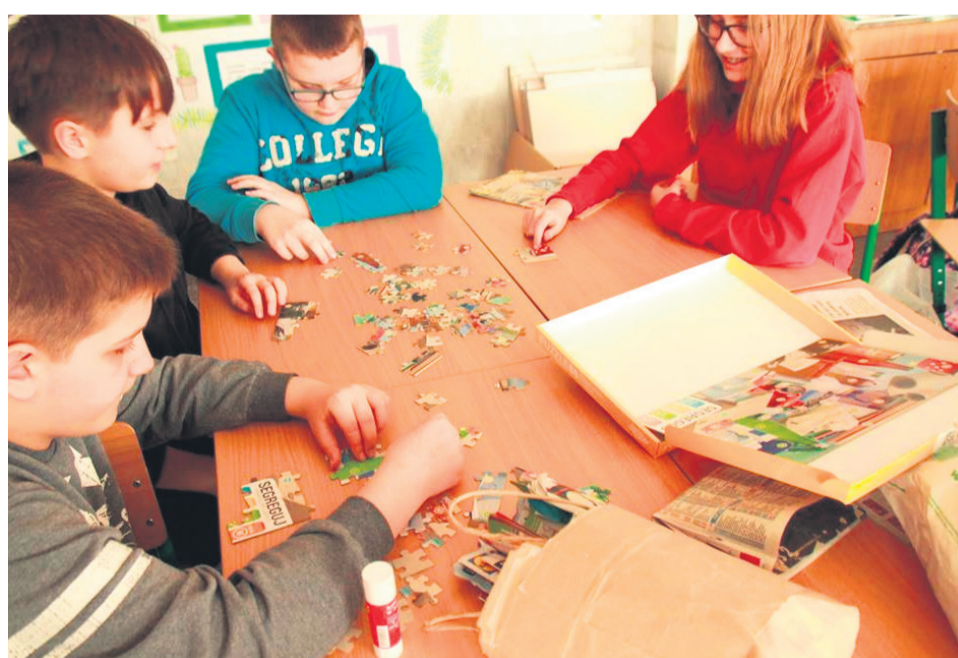
▲ Puzzle oraz memory edukacyjne

PROJEKT REALIZOWANY JEST PRZEZ NASTĘPUJĄCYCH PARTNERÓW: