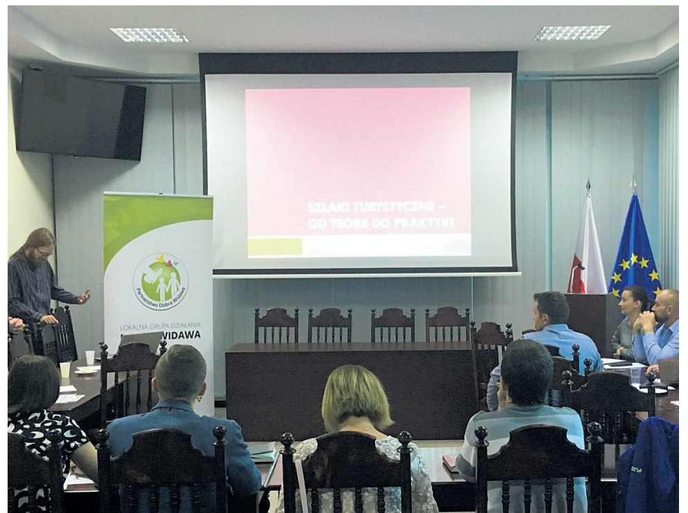
▲ Uczestnicy spotkania „Opracowanie dokumentacji dotyczącej szlaków turystycznych - rowerowych, konnych, kajakowych”