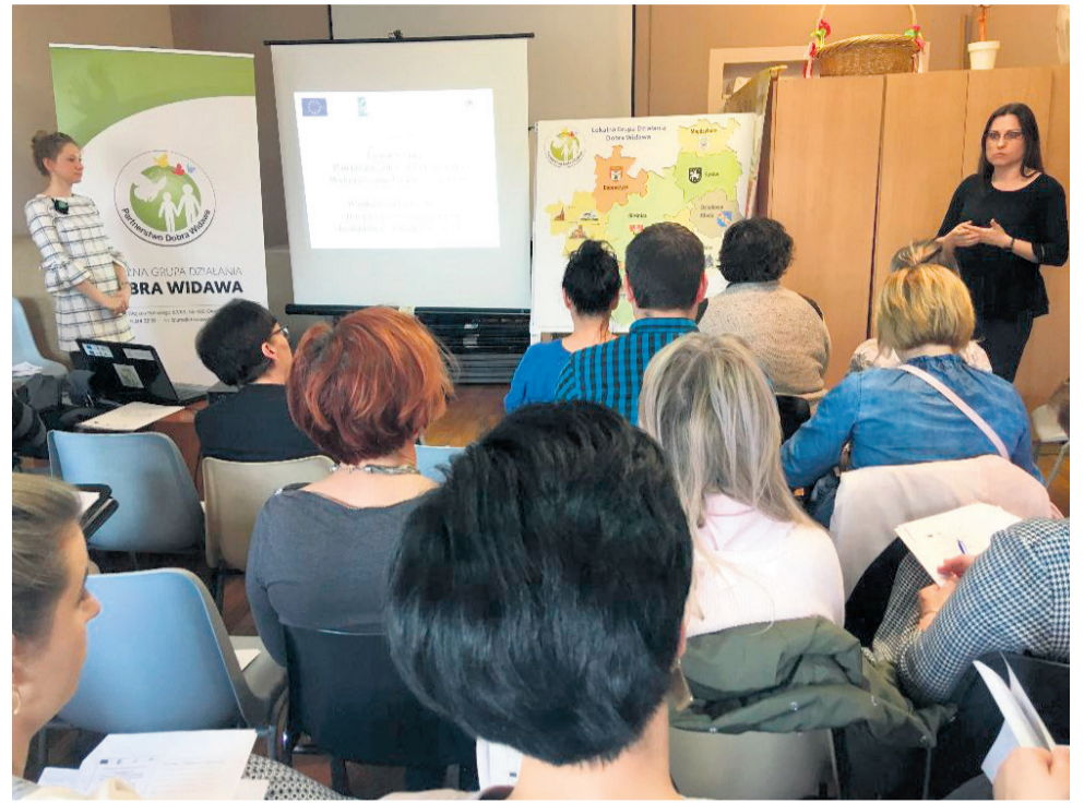
▲ Spotkanie informacyjne dotyczące projektu grantowego - Zabytki „Dobrej Widawy”