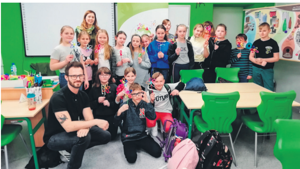
▲ Zdjęcie z przedstawicielami LGD na warsztatach w Sycowie

W projekcie zakupiono także edukacyjne gadżety, m.in.: magnesy z informacjami na temat segregacji odpadów oraz koszulki z logo projektu. Pod koniec czerwca do 10 ośrodków kultury na obszarze Partnerstwa zostaną przekazane komplety mebli wykonanych metodą upcyklingu, tzw. "upcyklingowe kąciki".