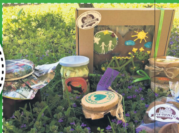
▲ Do Danii pojechały lokalne produkty z LGD Dobra Widawa