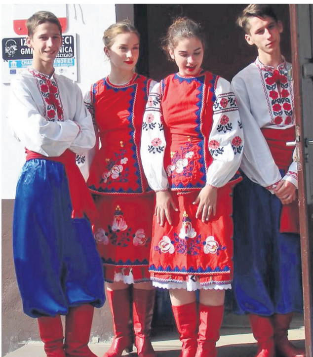
▲ Zespół Młodzieży Polskiej z Ukrainy