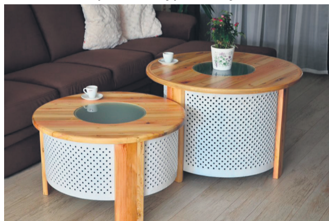
▲ Upcyklingowy stolik z bębna od pralki

nia odpadów, korzyści ze stosowania OZE. Odbędzie się także wyjazd w ramach wizyty studyjnej do Czech, aby podpatrywać dobre prakty-