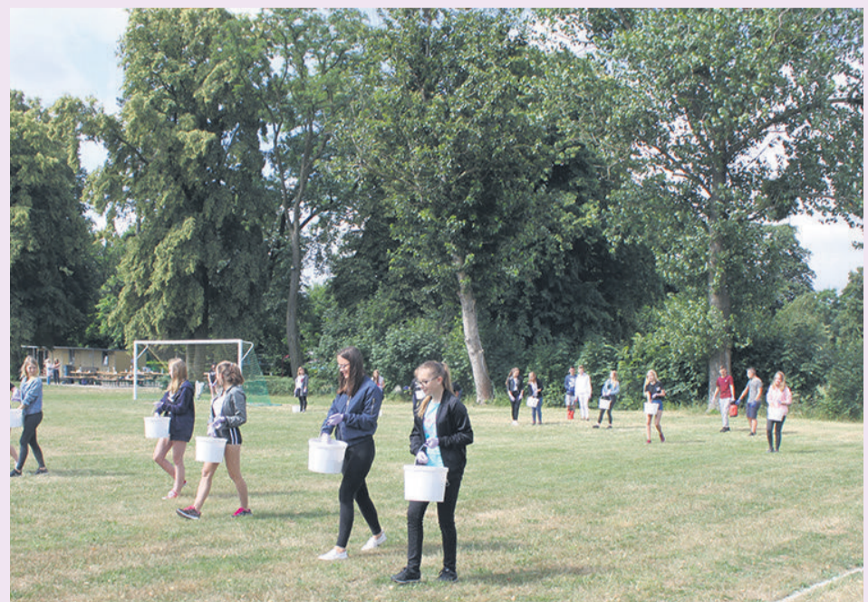
▲ Rekultywacja płyty boiska innowacyjną metodą probiotechnologii