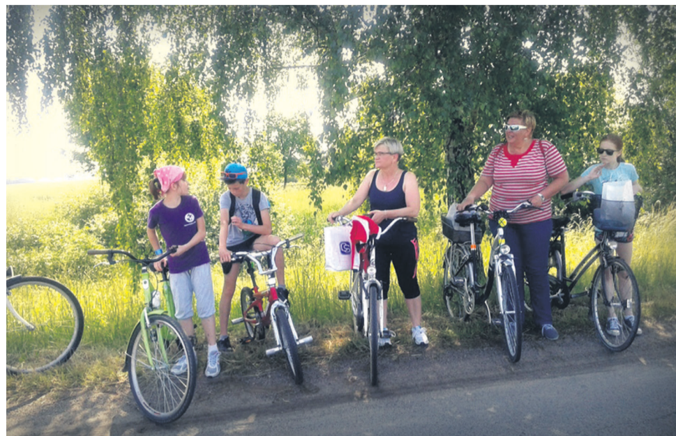
▲ Rajd rowerowy organizowany przez LGD Dobra Widawa

Zachodnim skrajem gm. Długoleka biegnie fragment międzynarodowego szlaku R9 Adriatyk - Bałtyk (10,5 km) , prowadzi on z Wrocławia przez Ramiszów, Pasikowice z klasycystycznym kościołem św. Józefa Oblubieńca, Siedlec z klasycystycznym pałacem i dalej przez Godziszową w kierunku Trzebnicy.