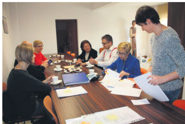
▲ Podpisanie umowy partnerskiej w dniu: 5.03.2018 r.

Projekt przewiduje szereg edukacyjnych proekologicznych działań. Jednym z nich będą z całą pewnością warsztaty dla dzieci podnoszące świadomość ekologiczną z zakresu segregacji odpadów, recyklingu i upcyklingu. W ramach realizacji projektu zaplanowano również wydanie publikacji - książki edukacyjnej z elementami komiksu dot. edukacji ekologicznej dla mieszkańców i turystów, segregowa-