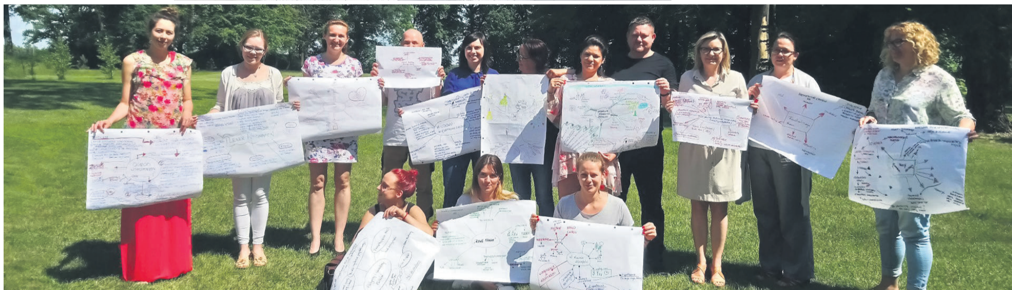
▲ Uczestnicy warsztatów „Akademia Umiejętności Animatora Lokalnej Grupy Działania”