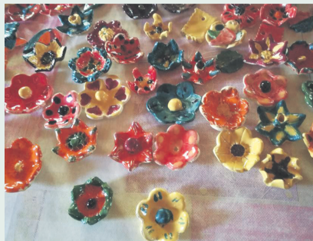
▲ Kwiatowe „Ręko - czyny”

Wspólna praca podczas tych zajęć była znakomitą okazją do integracji międzypokoleniowej, a także dała możliwość przekazania młodym uczestnikom informacji o tradycjach i zwyczajach związanych z rękodziełem. Nawiązywały one do bardzo popularnej na polskich wsiach tradycji ludowej Skubaczek (wspólnego darcia pierza) i Prządek (wspólnego przędzenia lnu na kołowrotkach), które późną