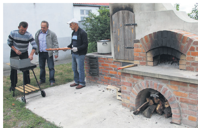
▲ Piec chlebowy

Po występach zespołów ludowych odbyły się warsztaty kulinarne poprowadzone przez Koło Gospodyń Wiejskich w Boguszycach. Spotkanie przy piecu „Z chlebem i solą - na ludową nutę” w Boguszycach zakończyła wspólna biesiada.