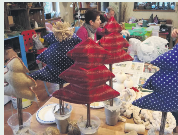
▲ „Ręko - czyny” na Jarmarku Bożonarodzeniowym w Pracowni Ceramiki w Domaszczynie

Nazwa grantobiorcy: Fundacja na rzecz Animacji Lokalnych „Słomkowy Melonik”.