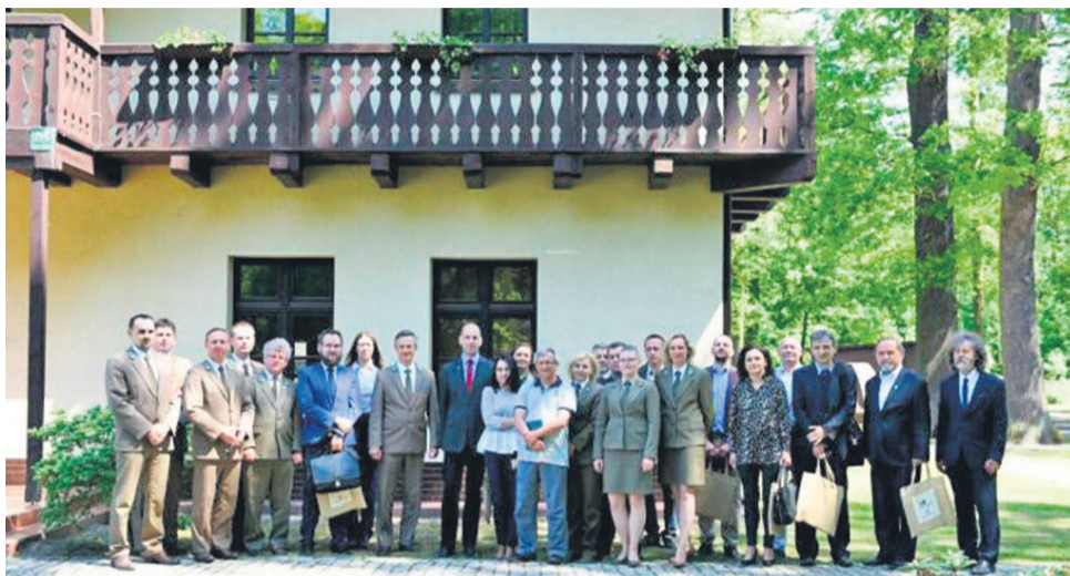
▲ Uczestnicy spotkania w Nadleśnictwie Antonin