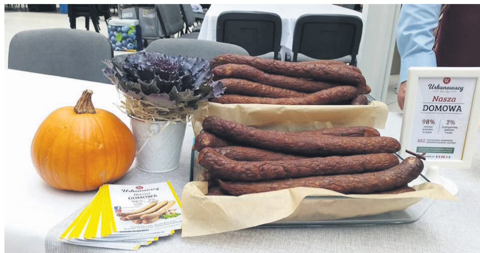
▲ Konkurs „Nasze Kulinarne Dziedzictwo - Smaki Regionów” w Pasażu Grunwaldzkim

25 sierpnia we wrocławskim Pasażu Grunwaldzkim odbyła się XVIII Edycja Konkursu „Nasze Kulinarne Dziedzictwo - Smaki Regionów”. Celem konkursu jest wyłonienie: najlepszego regionalnego i tradycyjnego produktu żywnościowego, najlepszego dania i potrawy regionalnej i tradycyjnej.