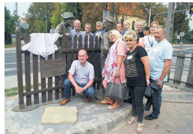
▲ XV edycja Festynu „Sami Swoi”