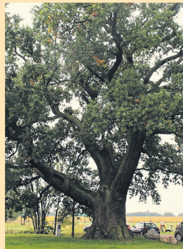
▲ „Dąb Słowianin” w Dębnie - 450-letni dąb szypułkowy