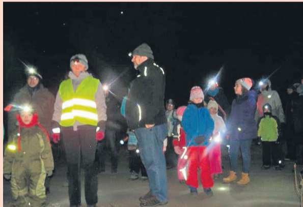
▲ Warsztaty: „Odgłosy nocy, czyli w poszukiwaniu puszczyka”