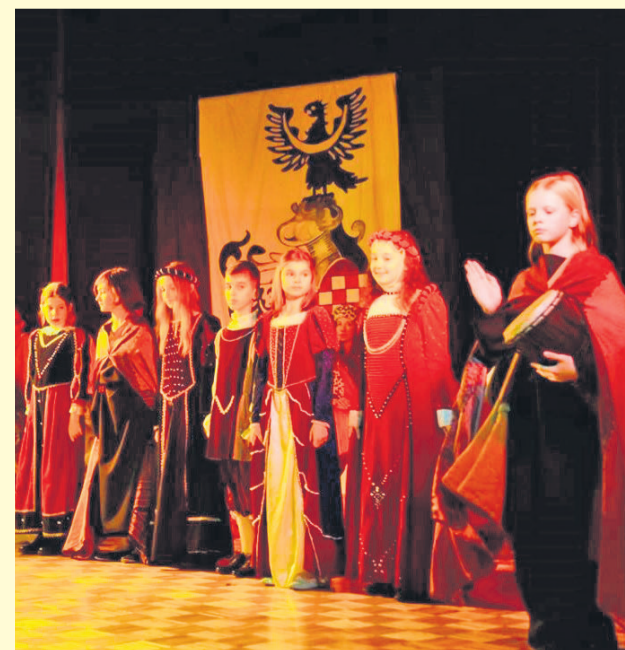
▲ Premiera spektaklu „Śladami Bosej Księżnej”

Wrocławskiej w Dobroszycach w przedstawieniu wzbudził wiele pozytywnych emocji wśród samych uczestników projektu, jak i widzów. Przedstawieniu towarzyszył wernisaż prac wykonanych w konkursie plastycznym pn.: „Śladami Bosej Księżnej”, który skierowany był do uczniów 2 szkół gminnych w Dobroszycach. Po premierze spektaklu w Gminnym Centrum Kultury w Dobroszycach nastąpiło rozdanie nagród laureatom konkursu.