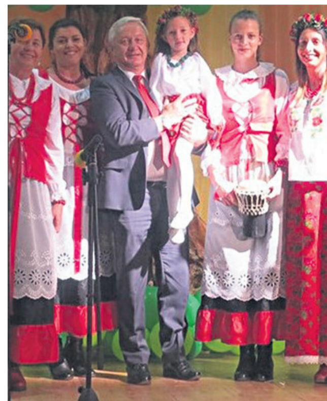
▲ Festiwal Kultury Ludowej w Wilkowie