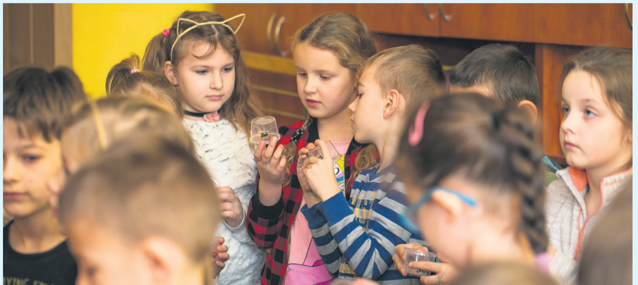
▲ A Ty jakiego masz owada?