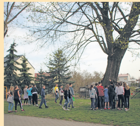
▲ Identyfikacja i udokumentowanie stanowisk sędziwych drzew na obszarze LGD Dobra Widawa.