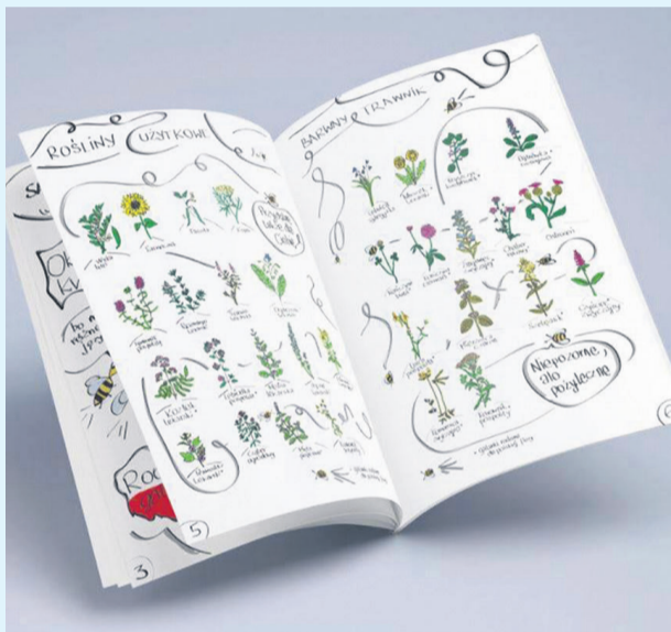
▲ Praktyczny poradnik ochrony pszczoł

Tylko świadome ekologicznie społeczeństwo jest w stanie dostrzec problem i skutecznie jemu przeciwdziałać. Dlatego niezwykle ważne jest, aby prowadzić takie edukacyjne projekty, jak „Syców zapyla!”. Działania tego typu pozwalają mieszkańcom w ciekawy sposób poznawać tajniki przyrody i uczą, jak chronić bioróżnorodność na „własnym podwórku”. Ważnym atutem miasta Syców jest potwierdzone występowanie dwóch gatunków rzadkich i zagrożonych wyginięciem trzmieli: trzmiela zmienego Bombus humilis i trzmiela paskowanego Bombus subterraneus . Świadczy to o dużym potencjale przyrodniczym oraz specyficznych warunkach siedliskowych. Również z terenu Sycowa pochodzi okaz trzmielca z kolekcji entomologicznej z przełomu XIX i XX w. autorstwa R. Dietricha, przechowywany w Muzeum Przyrodniczym Uniwersytetu Wrocławskiego. Wobec powyższych faktów bardzo stosowne jest podejmowanie odpowiednich kroków w celu uświadomienia mieszkańcom, jakie niezwykle zasoby przyrodnicze znajdują się w ich otoczeniu.