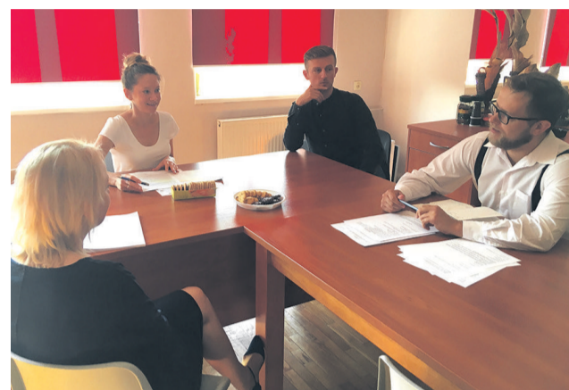
▲ Spotkanie polskich partnerów projektu „Kultura bez granic” w LGD Dobra Widawa

Projekt jest w trakcie przygotowywania. Obecnie trwają ustalenia partnerów mające na celu dopracowanie szczegółów działań. Zaplanowano m.in.: warsztatowe spotkania integracyjne dla rękodzielników i zespołów artystycznych, konkurs dla rękodzielników i zespołów artystycznych czy konferencję podsumowującą efekty prac warsztatowych. Istotnym elementem projektu będzie stworzenie strony internetowej z bazą podmiotów zajmujących się twórczością artystyczną tradycyj-