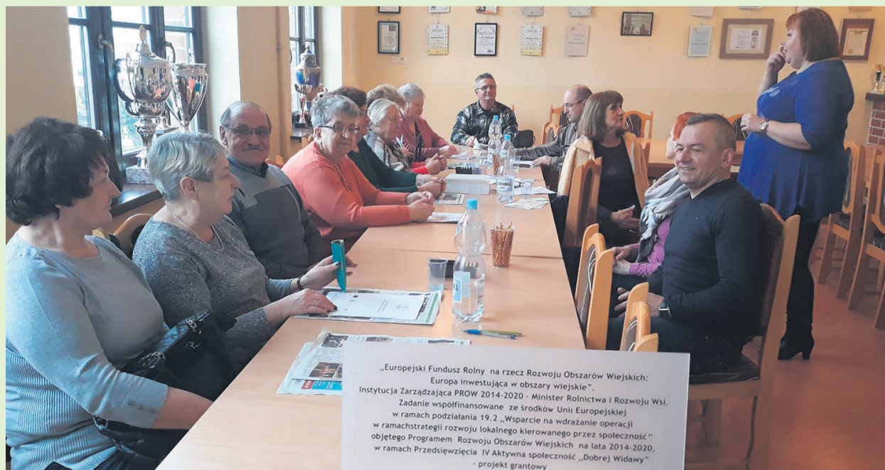
▲ Żyjmy dłużej, lepiej, bezpieczniej - praktyczne warsztaty dla aktywnego seniora