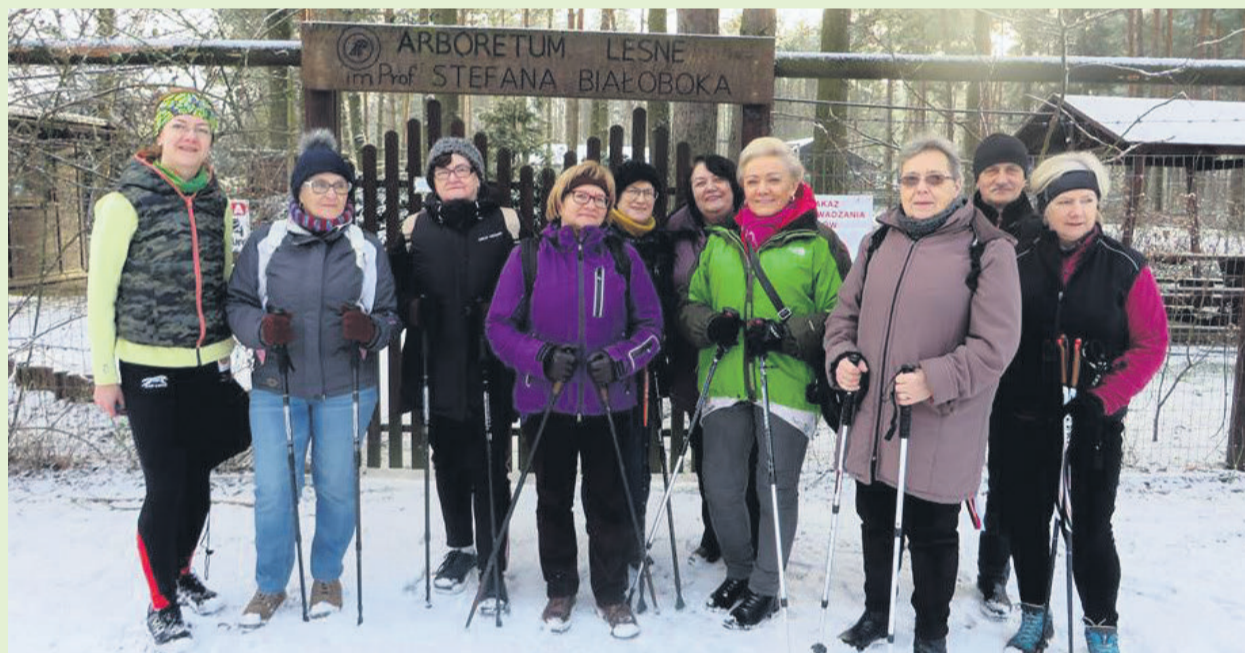
▲ Zimowy spacer nordic-walking

Frekwencja na warsztatach i zadowolenie uczestników świadczyło o zasadności prowadzenia takich działań warsztatowych oraz pojawiła się oddolna inicjatywa kontynuacji podobnych aktywności w przyszłości.