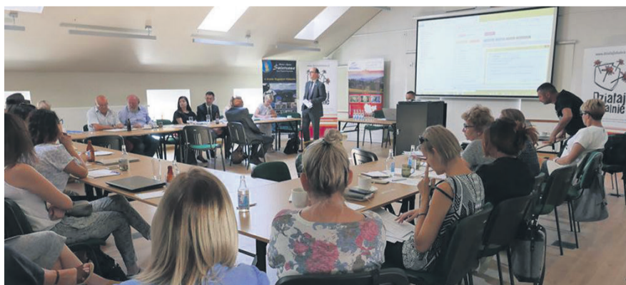
▲ Spotkanie Lokalnych Grup Działania z przedstawicielami UMWD