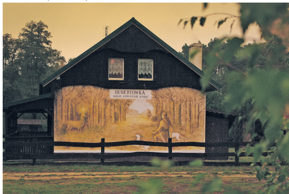
▼ Leśniczówka /Hubertówka/ w Malerzowie