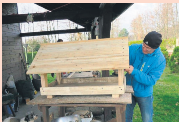
▲ Wspólne budowanie karmnika

Efekty realizacji niniejszego projektu to: