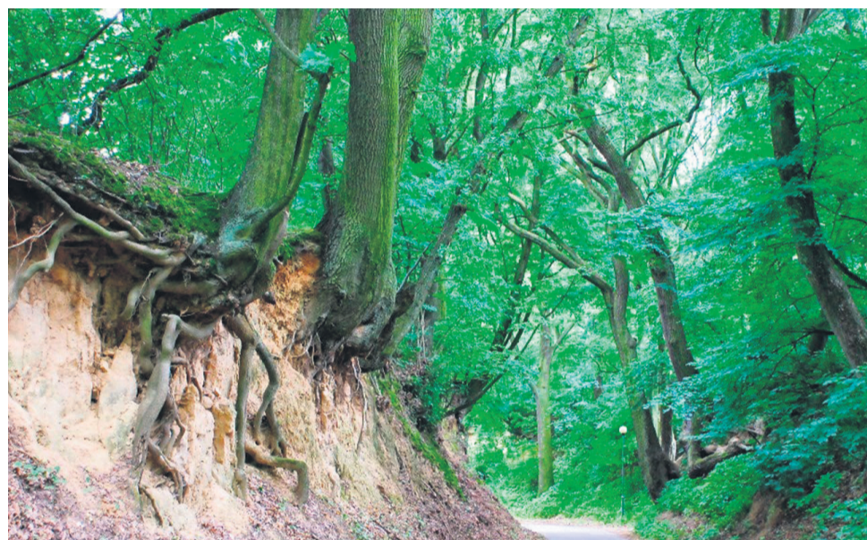
▲ Wąwóz w Zaprzężynie