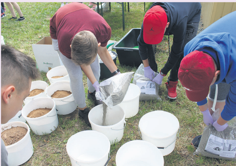
▲ Rekultywacja płyty boiska

Rekultywacja płyty boiska oraz kompostowanie zostało poprzedzone warsztatami szkoleniowymi, tak aby osoby, uczestniczące w warsztacie, otrzymały fachową wiedzę i część prac wykonały samodzielnie pod okiem doświadczonych szkoleniowców.