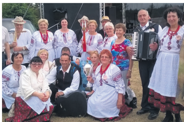
▲ Biskupicki Złoty Kłos

zespoły ludowe, najlepsze z nich otrzymały nagrody. W imprezie wzięło udział również 34 wystawców produktu lokalnego z powiatu oławskiego i Dolnego Śląska. Tradycyjnie zakupić można było produkty wytwarzane techniką lokalną, m.in. miody, cydry, piwa, wina, wędliny, ciasta, oleje i wiele innych. Po części oficjalnej wszyscy zgromadzeni uczestniczyli w biesiadzie.